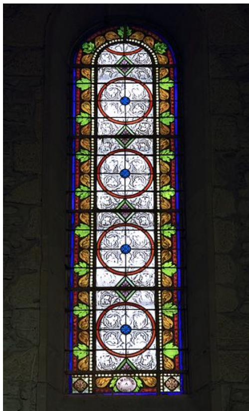
Vue d'ensemble d'une des baies. 25, Labergement-Sainte-Marie