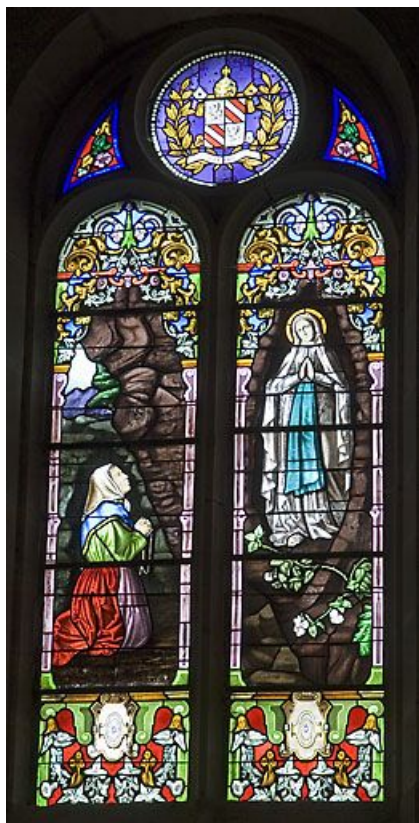
Baie 5 : Notre-Dame de Lourdes. 25, Labergement-Sainte-Marie