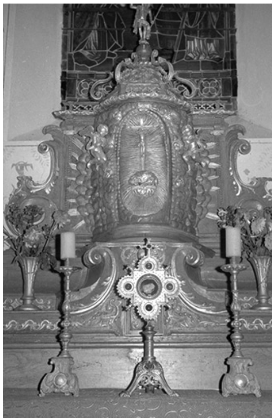
Tabernacle, chandelier d'autel et reliquaire en 1968. 25, Labergement-Sainte-Marie, lieudit : Grange Neuve