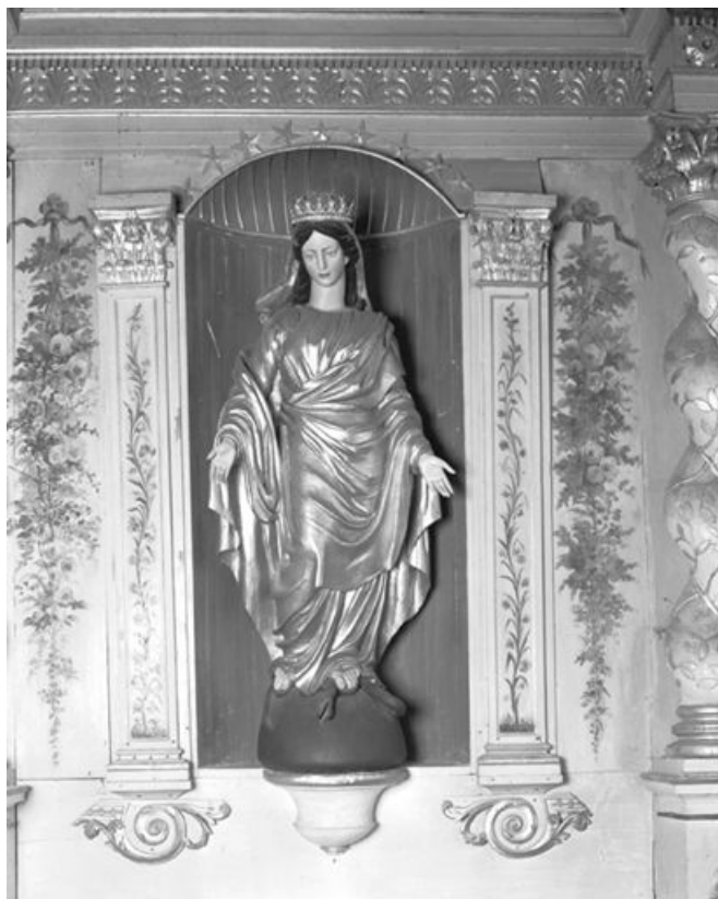
La niche du retable.