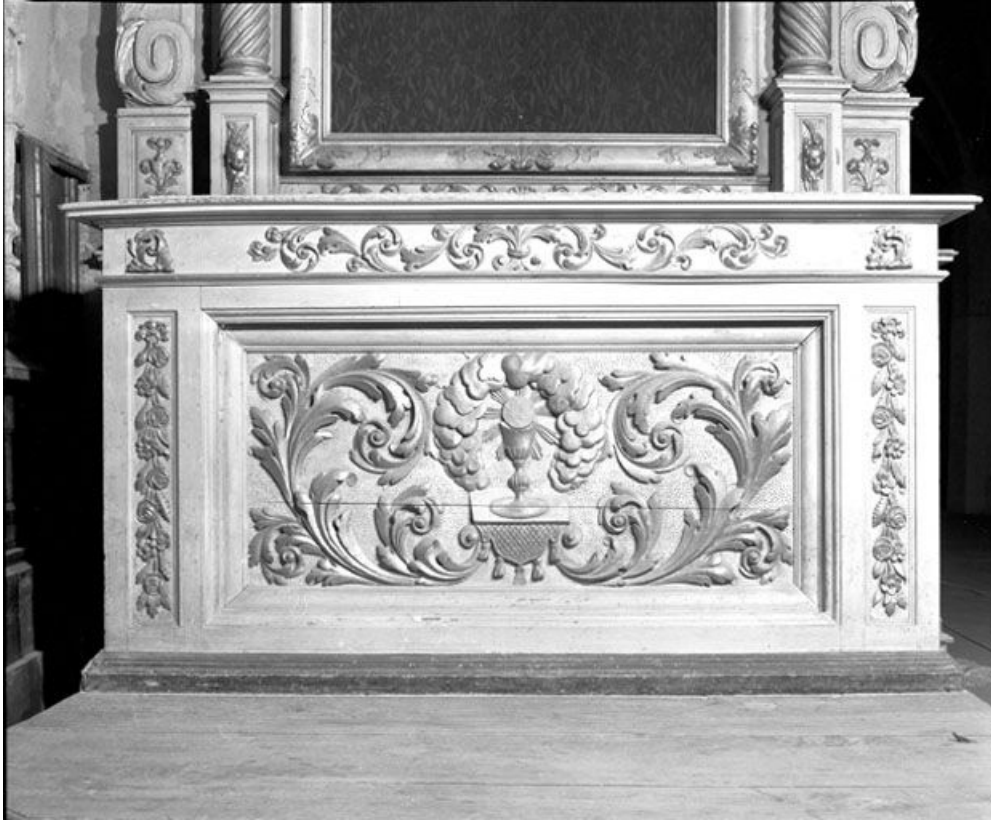
Face antérieure de l'autel.