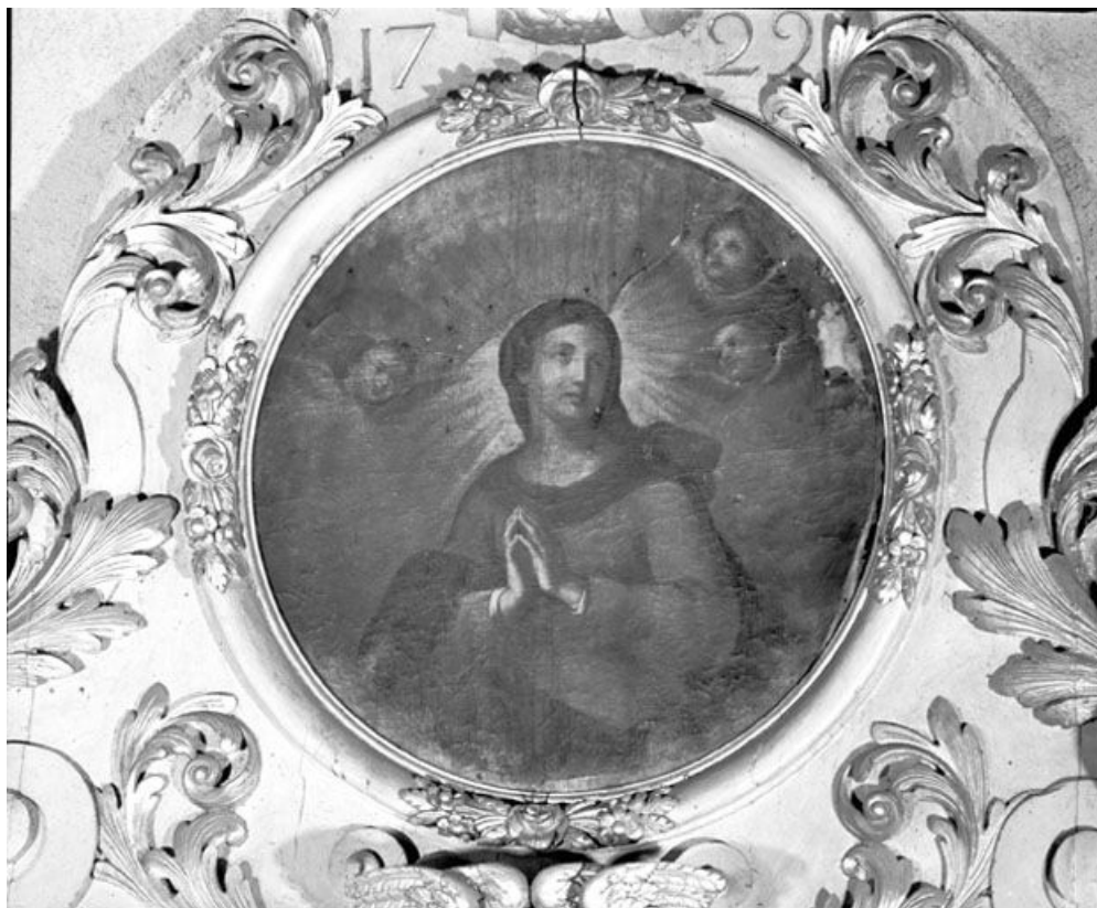
Tableau du couronnement : la Vierge.