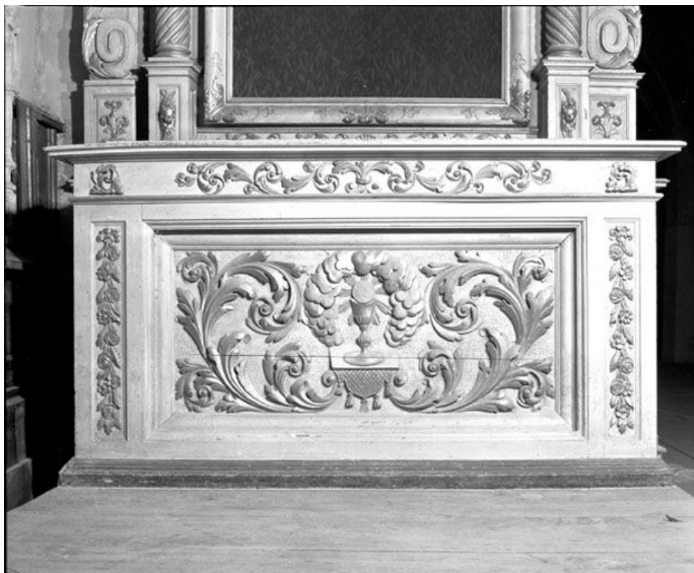
Face antérieure de l'autel.