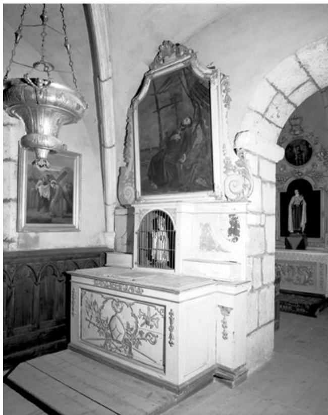
Vue d'ensemble de trois quarts gauche. 25, Chaux-Neuve