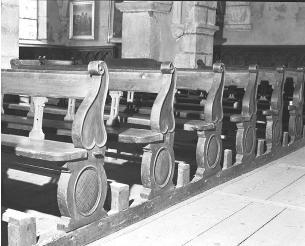
Vue d'ensemble. 25, Chaux-Neuve