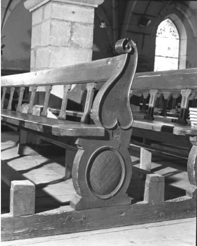
Vue d'un côté. 25, Chaux-Neuve