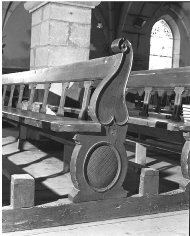
Vue d'un côté.