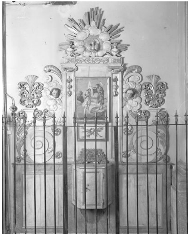
Vue d'ensemble. 25, Châtelblanc