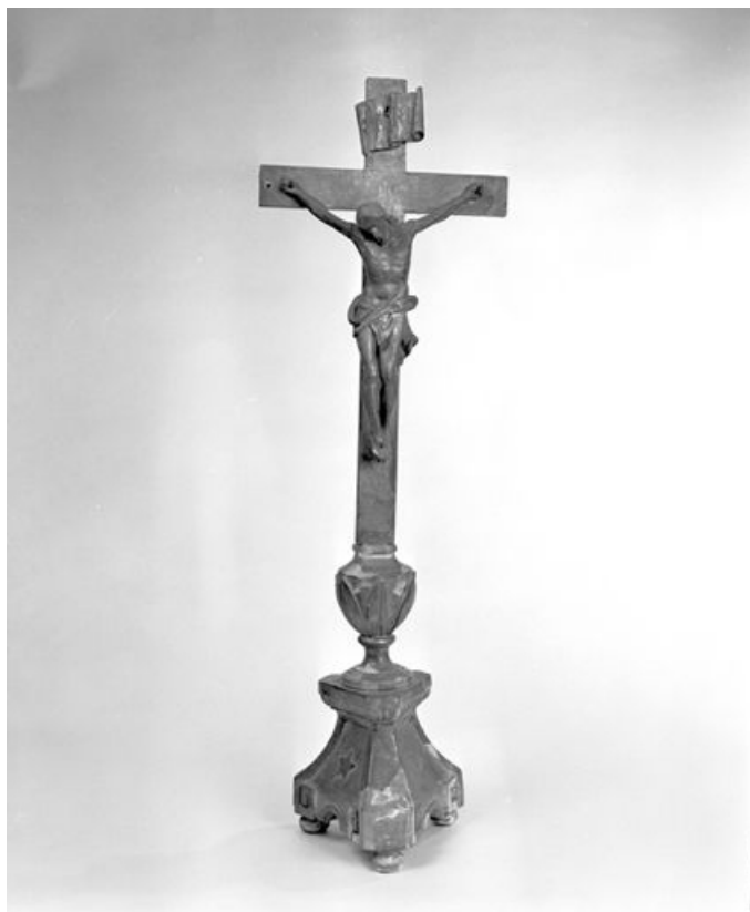
Vue générale. 25, Châtelblanc