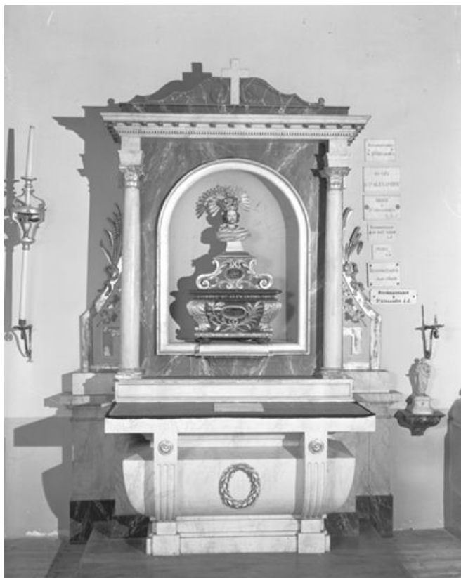
Vue d'ensemble de l'autel secondaire nord. 25, Châtelblanc