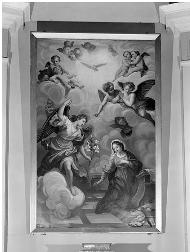
Vue générale. 25, Châtelblanc