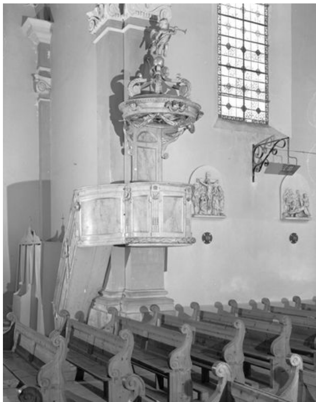
Vue générale. 25, Châtelblanc