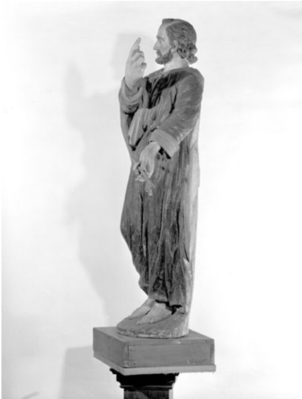
Vue de profil gauche.