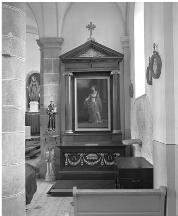
Vue d'ensemble de l'autel secondaire sud. 25, Gellin