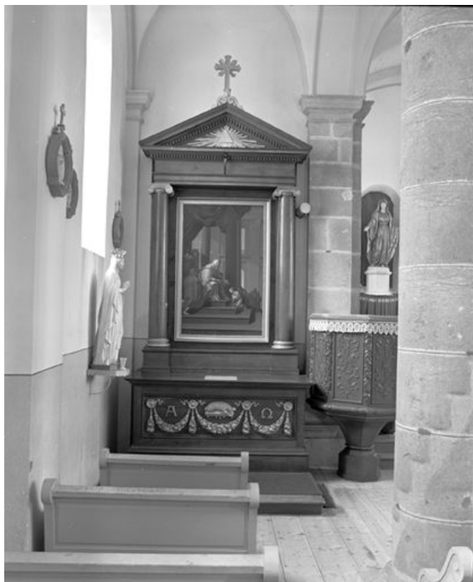
Vue d'ensemble de l'autel secondaire nord. 25, Gellin