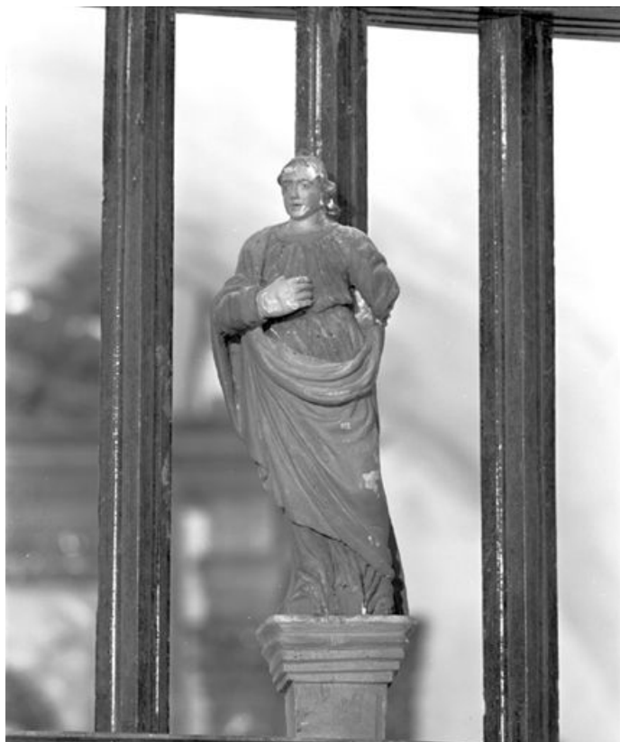
Saint Jean. 25, Le Crouzet