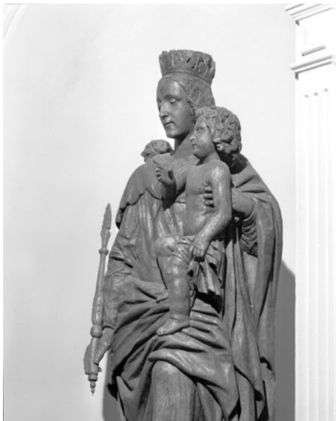
Détail, vue à mi-corps de trois quarts gauche.

25, Brey-et-Maison-du-Bois, lieudit : le Brey