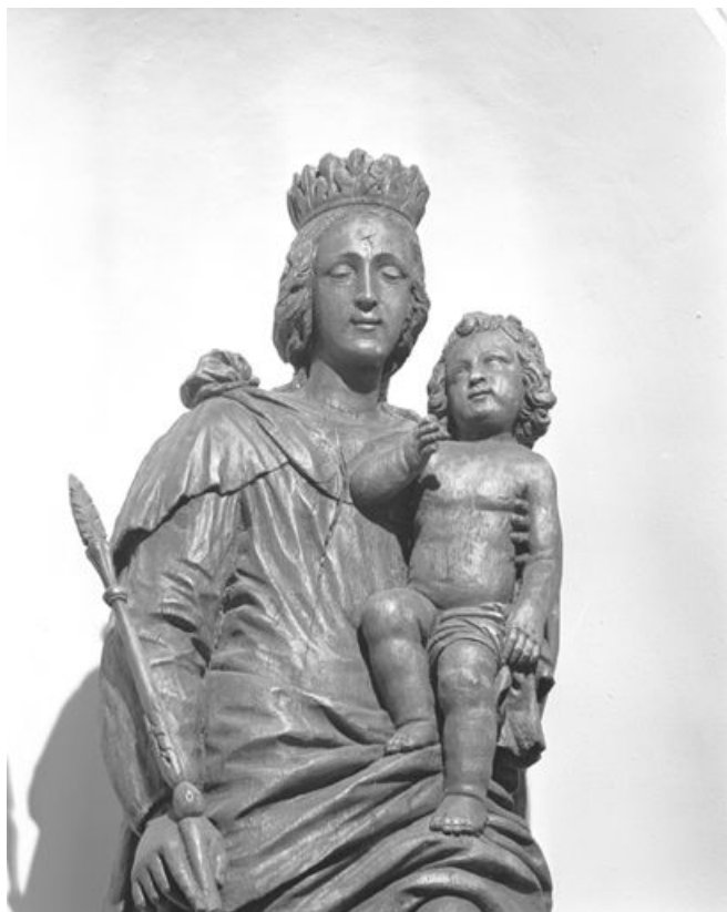
Détail, vue à mi-corps de face.

25, Brey-et-Maison-du-Bois, lieudit : le Brey