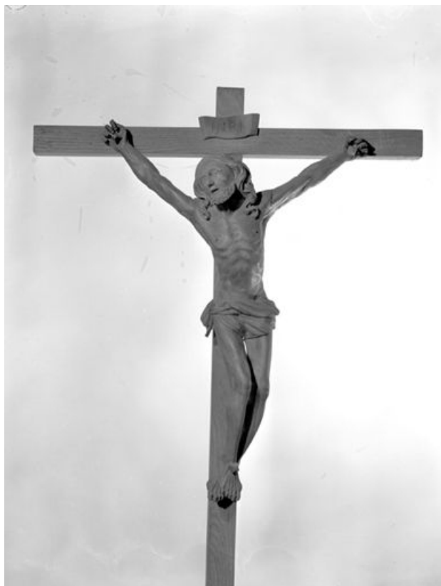
Vue générale. 25, Bonnevaux