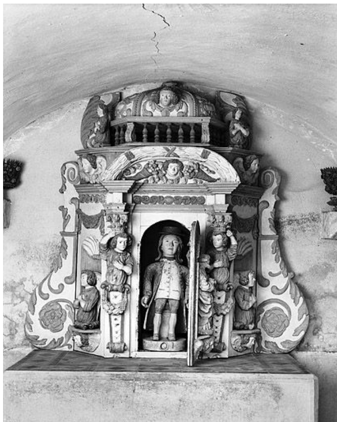
Vue du tabernacle ouvert.