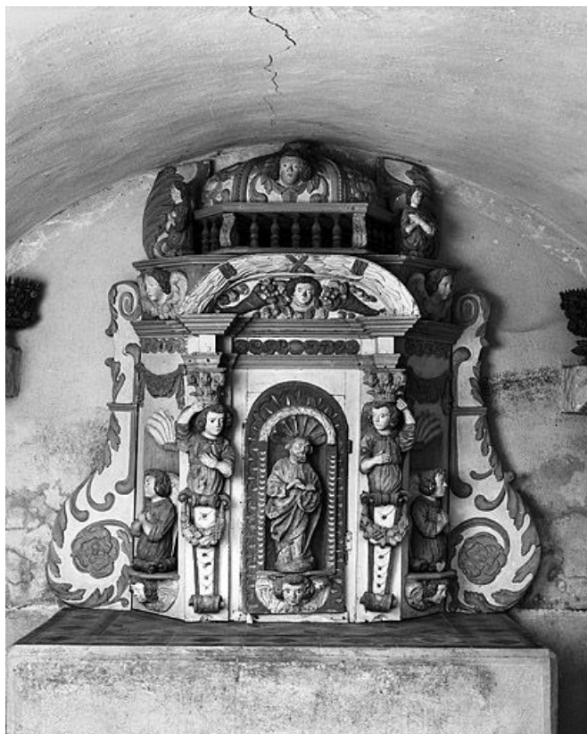
Vue du tabernacle fermé.