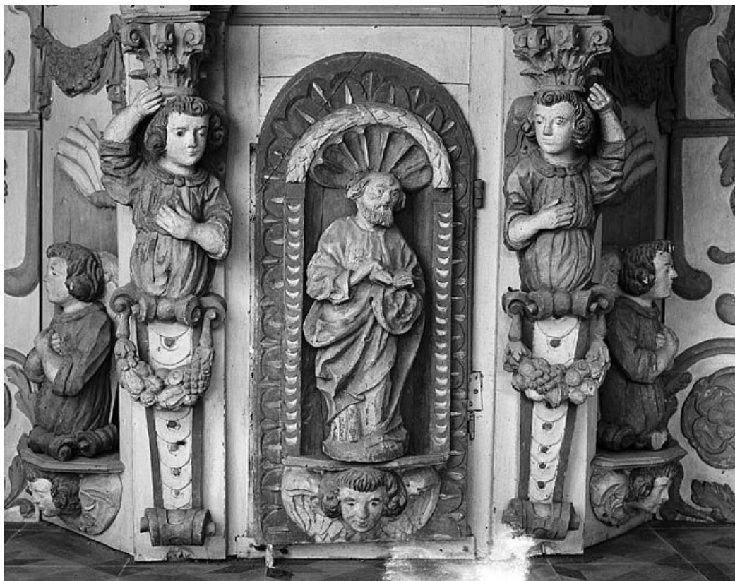
Statuette ornant la porte du tabernacle.