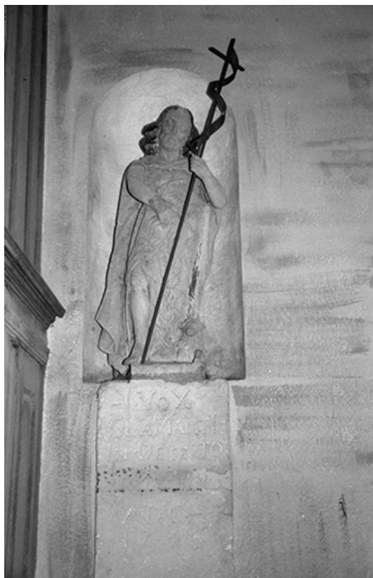
Vue d'ensemble en 1968.