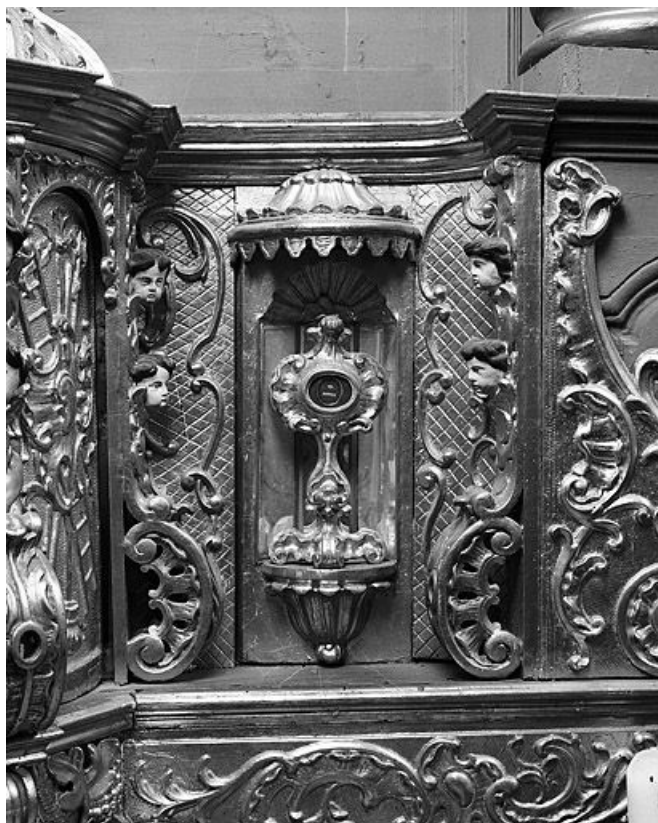
Vue générale d'un reliquaire.