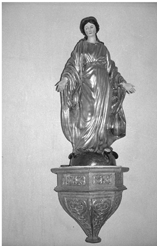
Statue de la Vierge