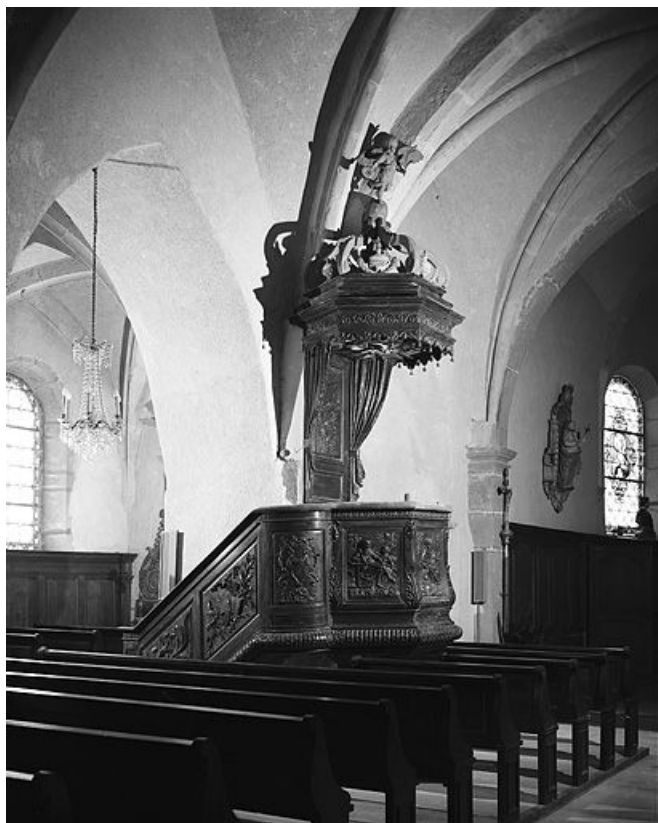
Vue d'ensemble. 25, La Planée