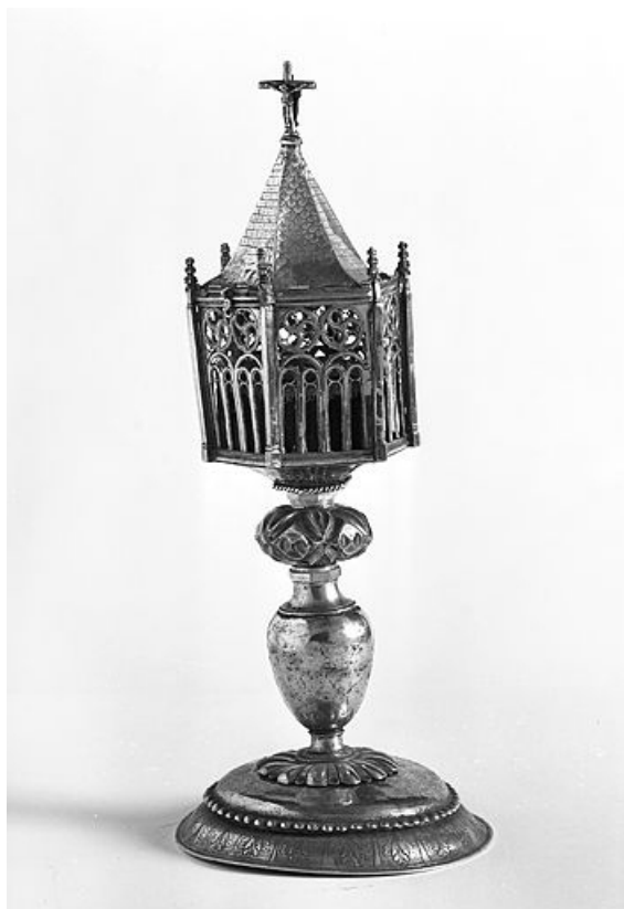
Vue générale avec toit fermé.