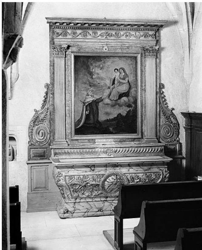
Vue d'ensemble de l'autel secondaire nord. 25, La Planée