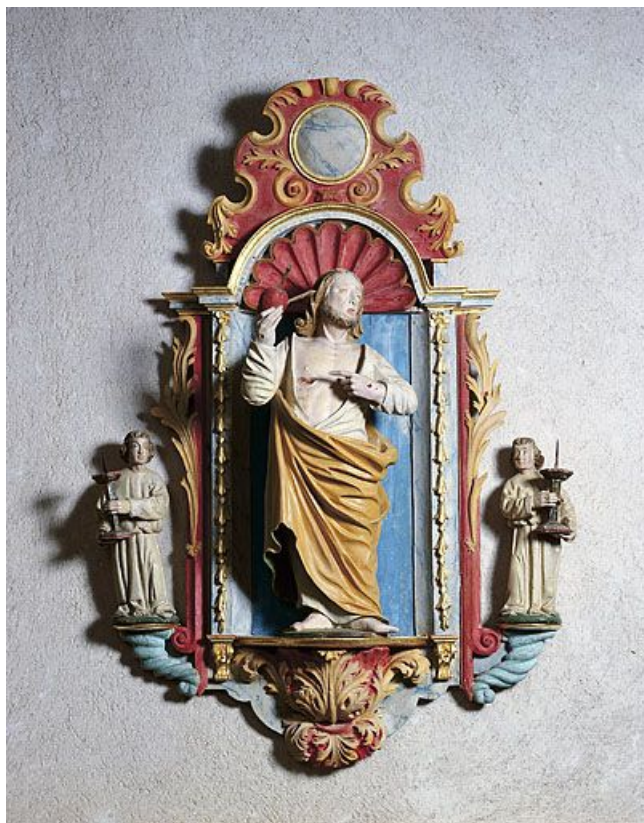
Sacré Cœur. 25, La Planée