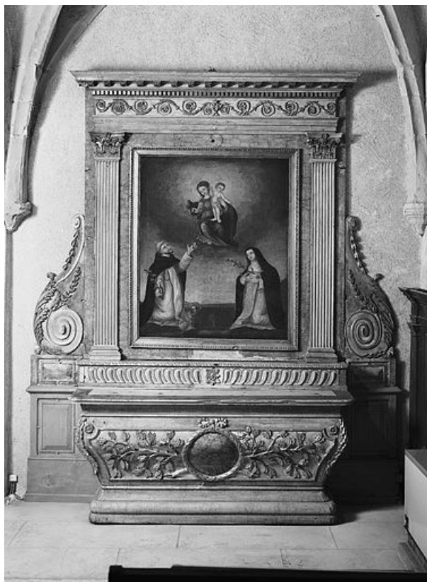
Vue d'ensemble de l'autel secondaire sud. 25, La Planée