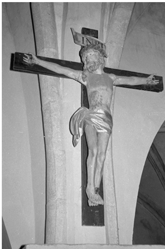
Christ en croix 25, La Planée