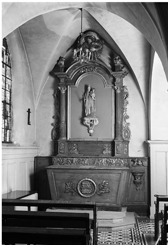
Vue d'ensemble. 25, Oye-et-Pallet