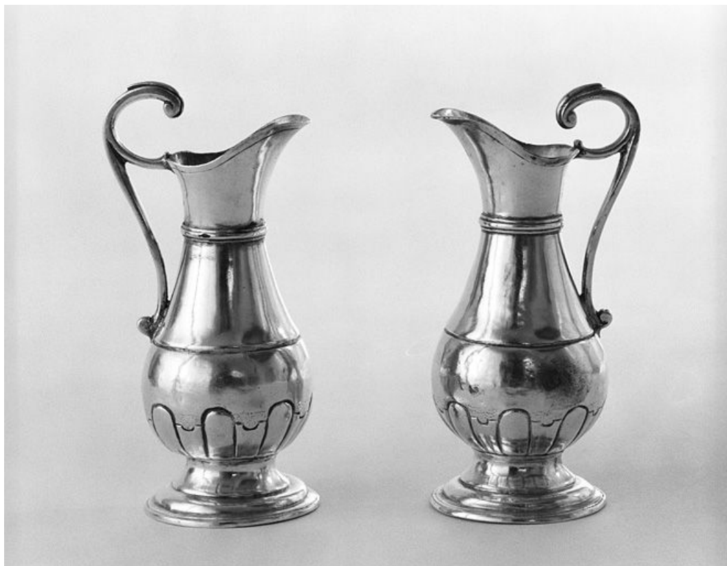
Vue d'ensemble. 25, Oye-et-Pallet