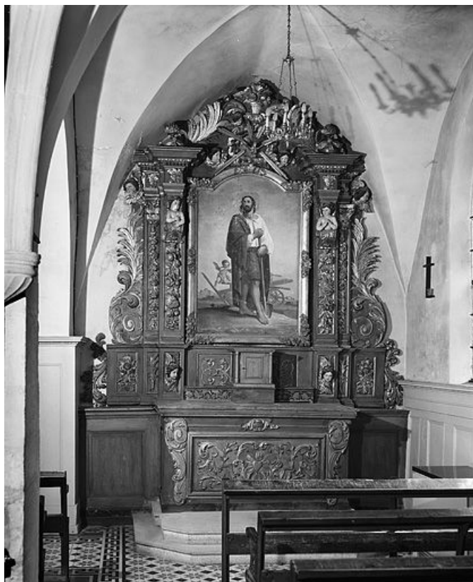
Vue d'ensemble. 25, Oye-et-Pallet