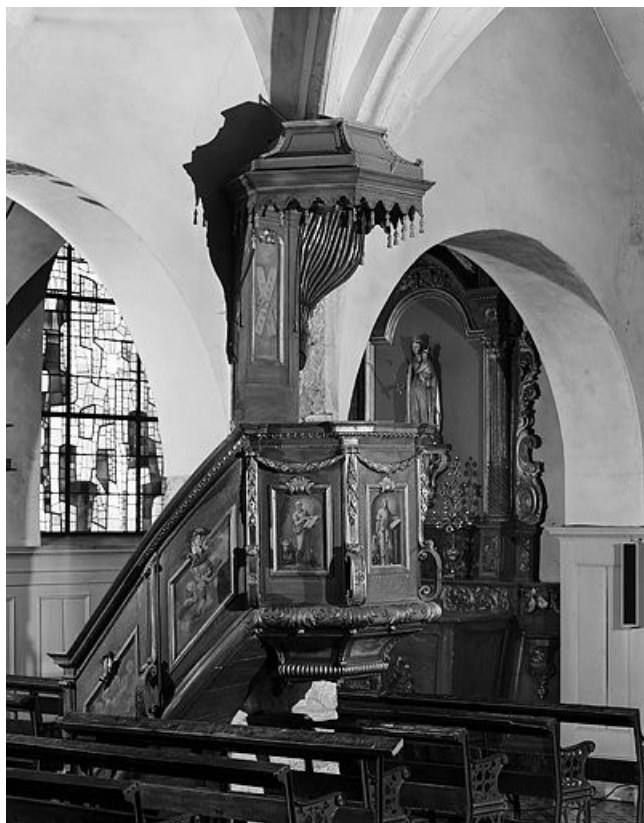
Vue d'ensemble. 25, Oye-et-Pallet