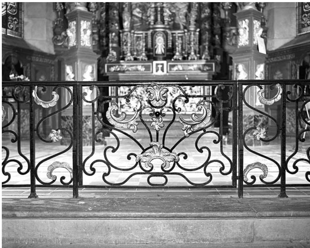
Vue du portillon central.