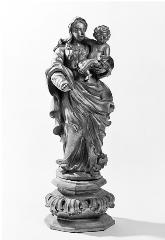
Vierge à l'Enfant.