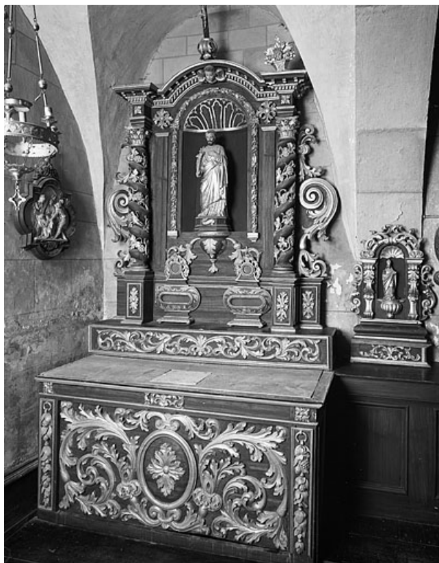
Vue d'ensemble de l'autel secondaire nord. 25, Les Hôpitaux-Neufs