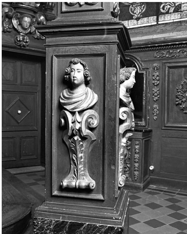
Détail : décor des piédestaux du baldachin. 25, Les Hôpitaux-Neufs