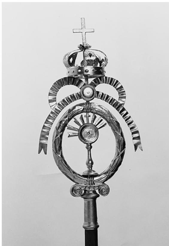
Bâton de procession n° 1 : ostensor.