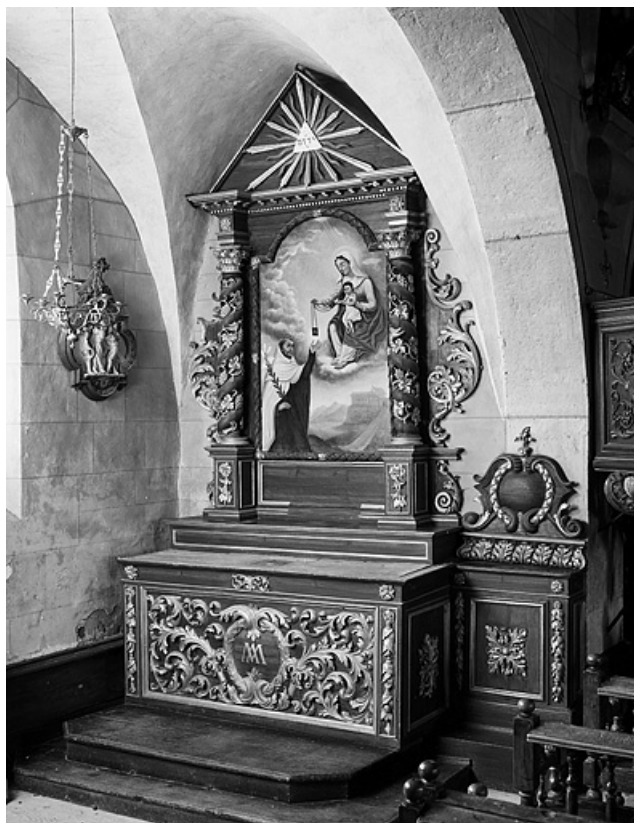
Donation du scapulaire. 25, Les Hôpitaux-Neufs