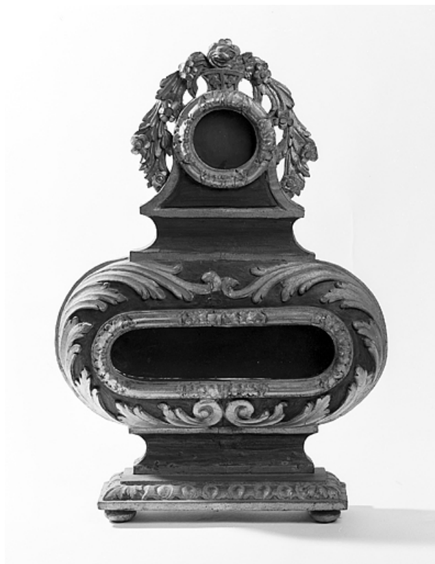
Vue d'ensemble d'un reliquaire.