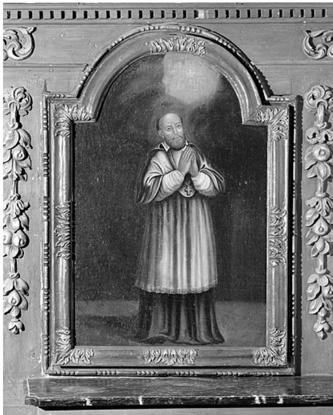
Saint François-Xavier. 25, Les Hôpitaux-Neufs