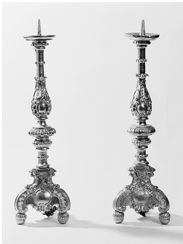
Vue de 2 chandeliers d'autel.