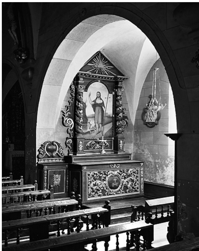
Vue d'ensemble de l'autel secondaire sud. 25, Les Hôpitaux-Neufs