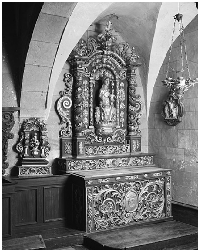
Vue d'ensemble de l'autel secondaire sud. 25, Les Hôpitaux-Neufs