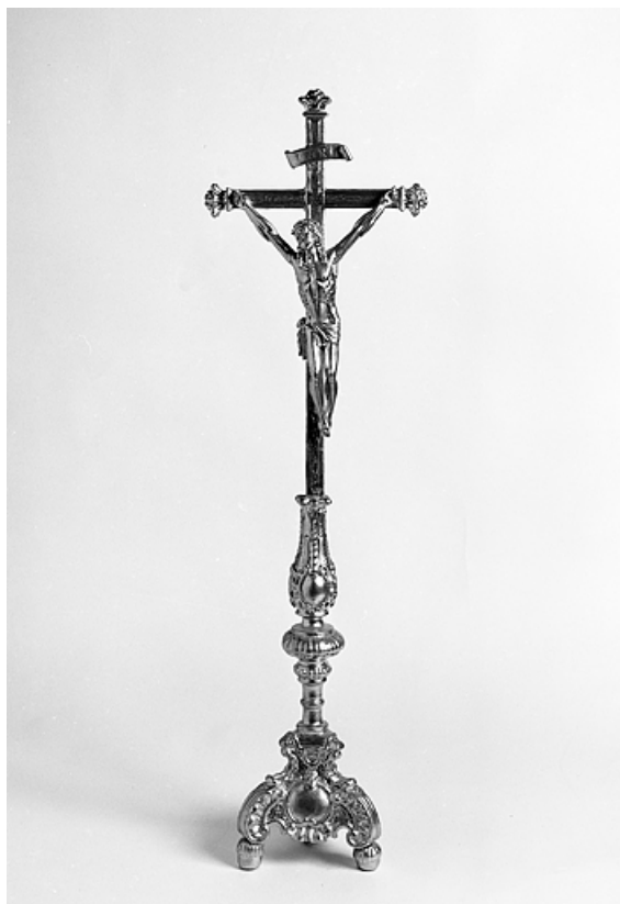
Vue de la croix d'autel.