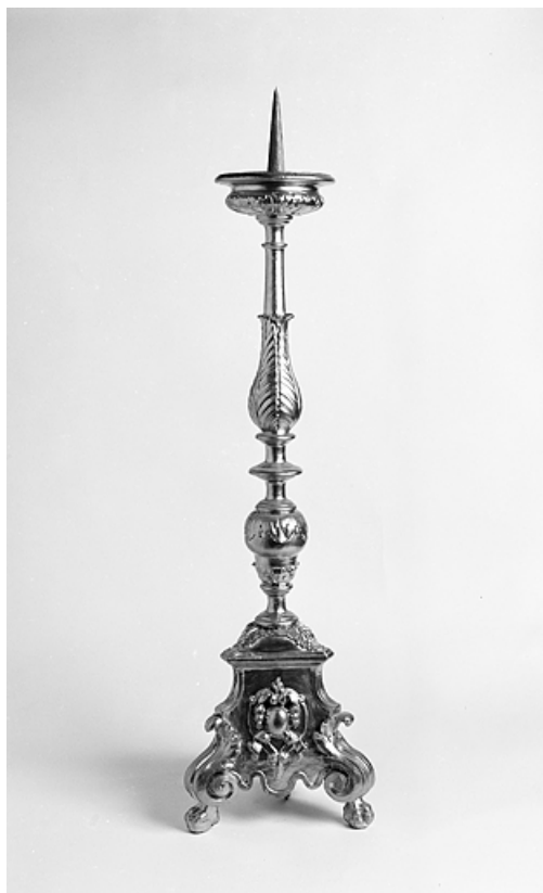
Vue d'ensemble d'un chandelier d'autel.