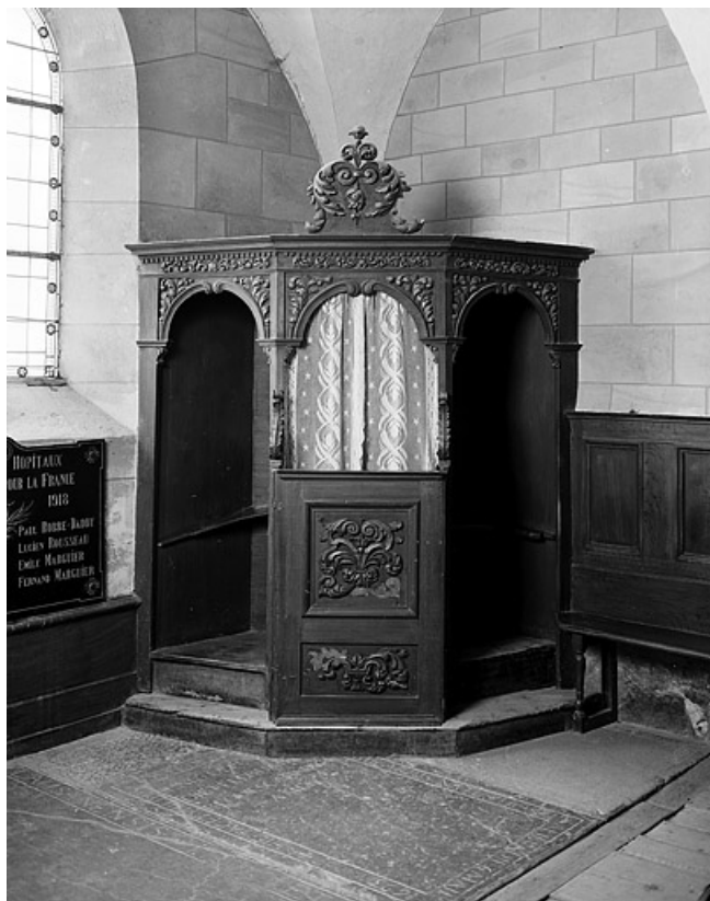
Vue d'ensemble d'un confessionnal.