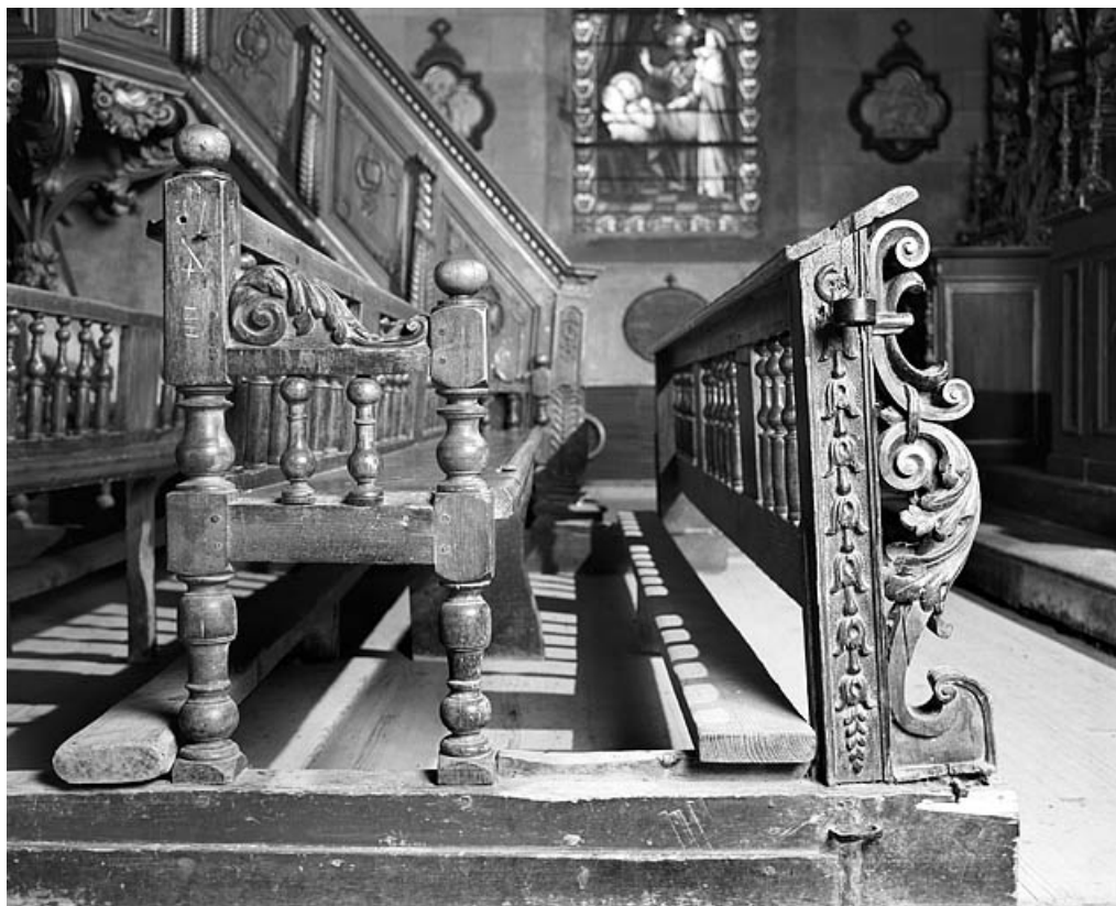
Vue d'un banc.