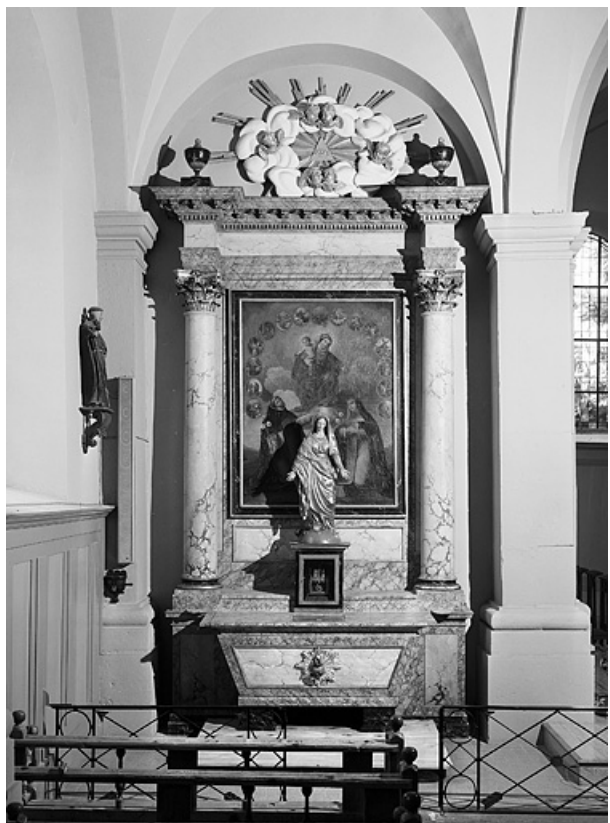
Vue d'ensemble de l'autel secondaire nord.