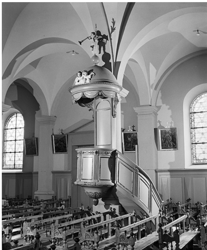
Vue d'ensemble. 25, Les Fourgs