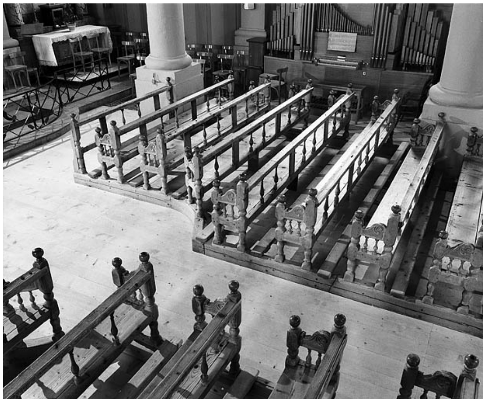
Vue d'ensemble. 25, Les Fourgs