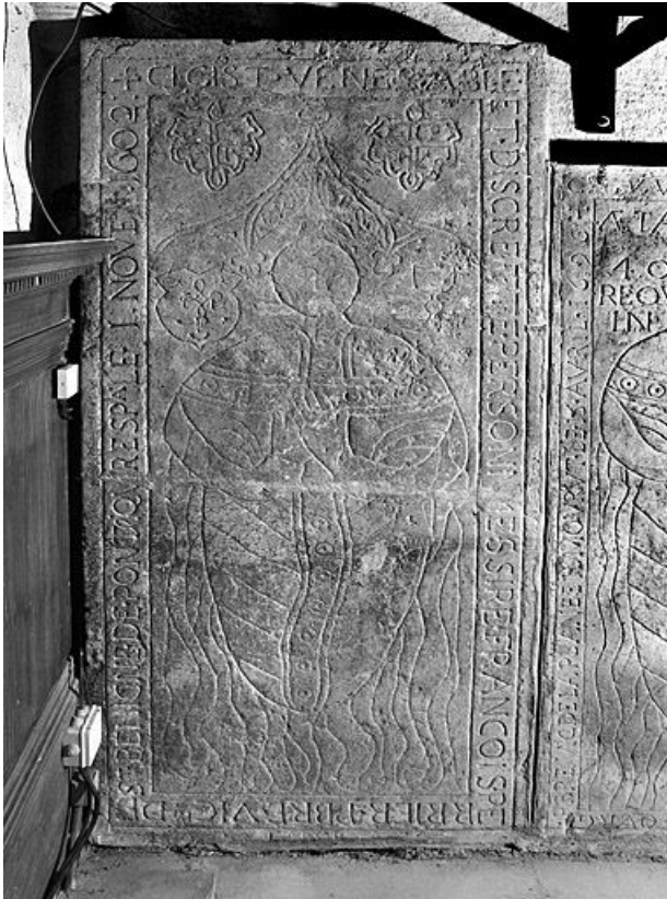
Vue de face 25, La Planée