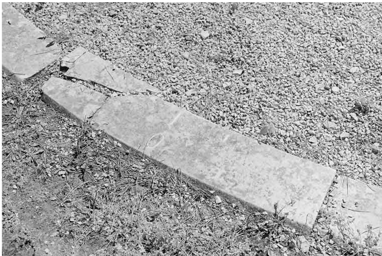
L'une des pierres de l'ellipse, avant restauration.

25, Besançon, 34, 36, 41 à 43 avenue de l' Observatoire, lieudit : la Bouloie