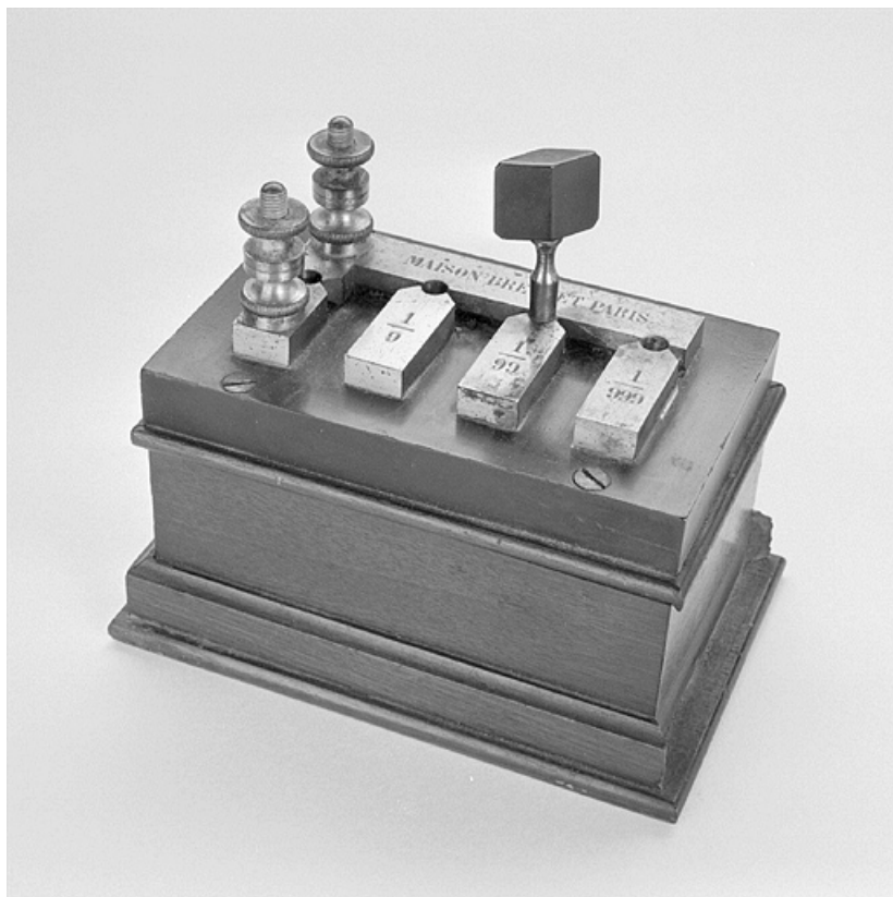
Shunt : vue d'ensemble.

25, Besançon, 34, 36, 41 à 43 avenue de l' Observatoire, lieudit : la Bouloie