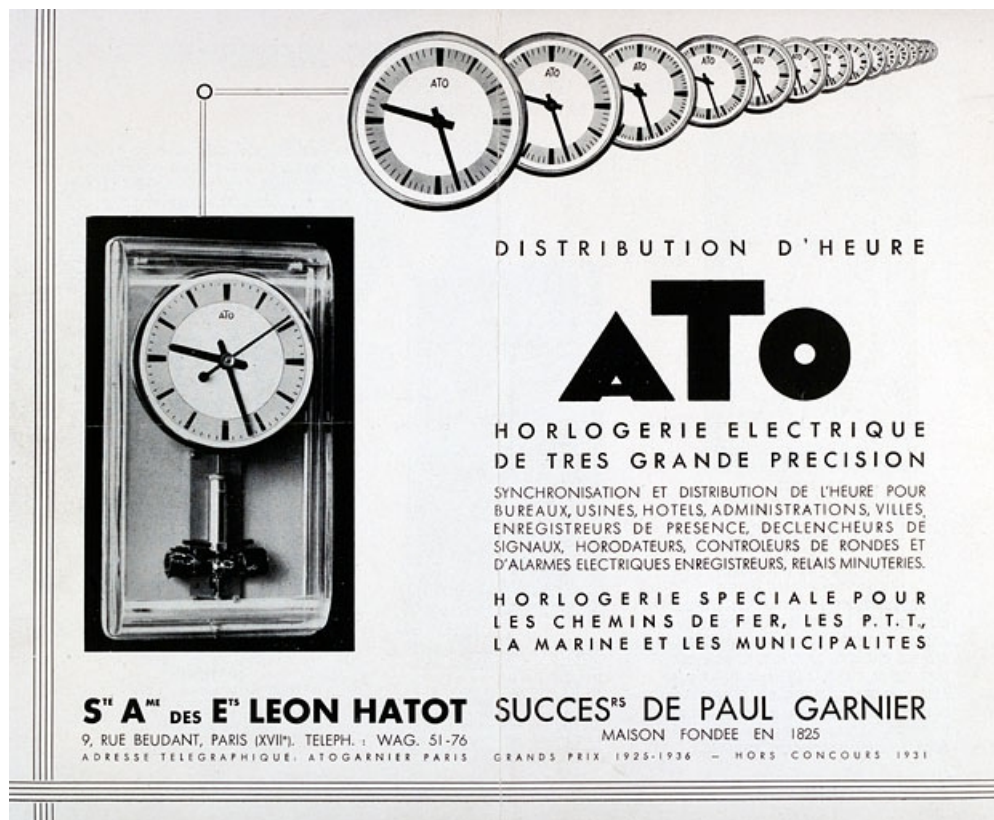
Distribution d'heure Ato [horloge mère modèle 13.020 et horloges réceptrices], vers 1960. 25, Besançon, 34, 36, 41 à 43 avenue de l' Observatoire, lieudit : la Bouloie

Dessin, s.d. [vers 1960].. Dans : [Notice dépliant] / société Ato, s.d. [vers 1960]. Lieu de conservation : Archives de l'Observatoire, Besançon