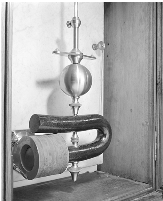
Le balancier (avec masse circulaire et aimant).

25, Besançon, 34, 36, 41 à 43 avenue de l' Observatoire, lieudit : la Bouloie