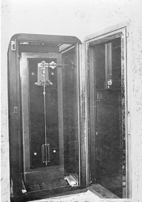
[Pendule Leroy n° 16419, dans une armoire à pression contrôlée], 1ère moitié 20e siècle ?

25, Besançon, 34, 36, 41 à 43 avenue de l' Observatoire, lieudit : la Bouloie