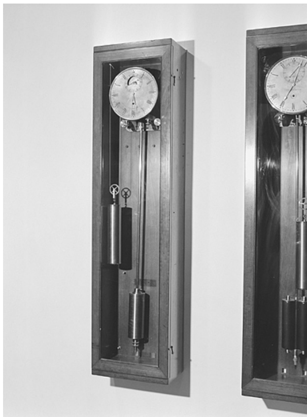
Vue d'ensemble. A droite, l'horloge Fénon n° 114.

25, Besançon, 34, 36, 41 à 43 avenue de l' Observatoire, lieudit : la Bouloie