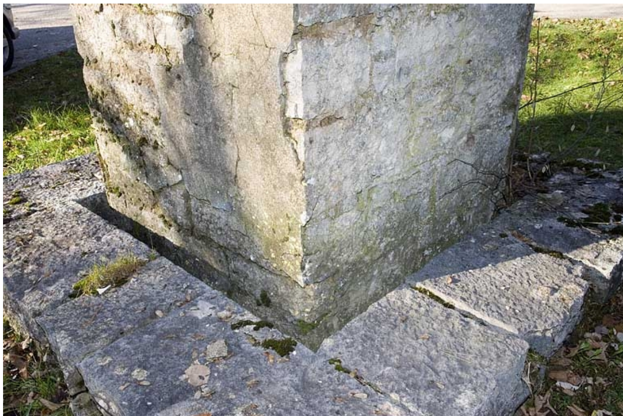
Mire sud de la lunette méridienne, pilier sud : fossé de stabilisation à la base du pilier. 25, Besançon, 34 avenue de l' Observatoire, lieudit : la Bouloie