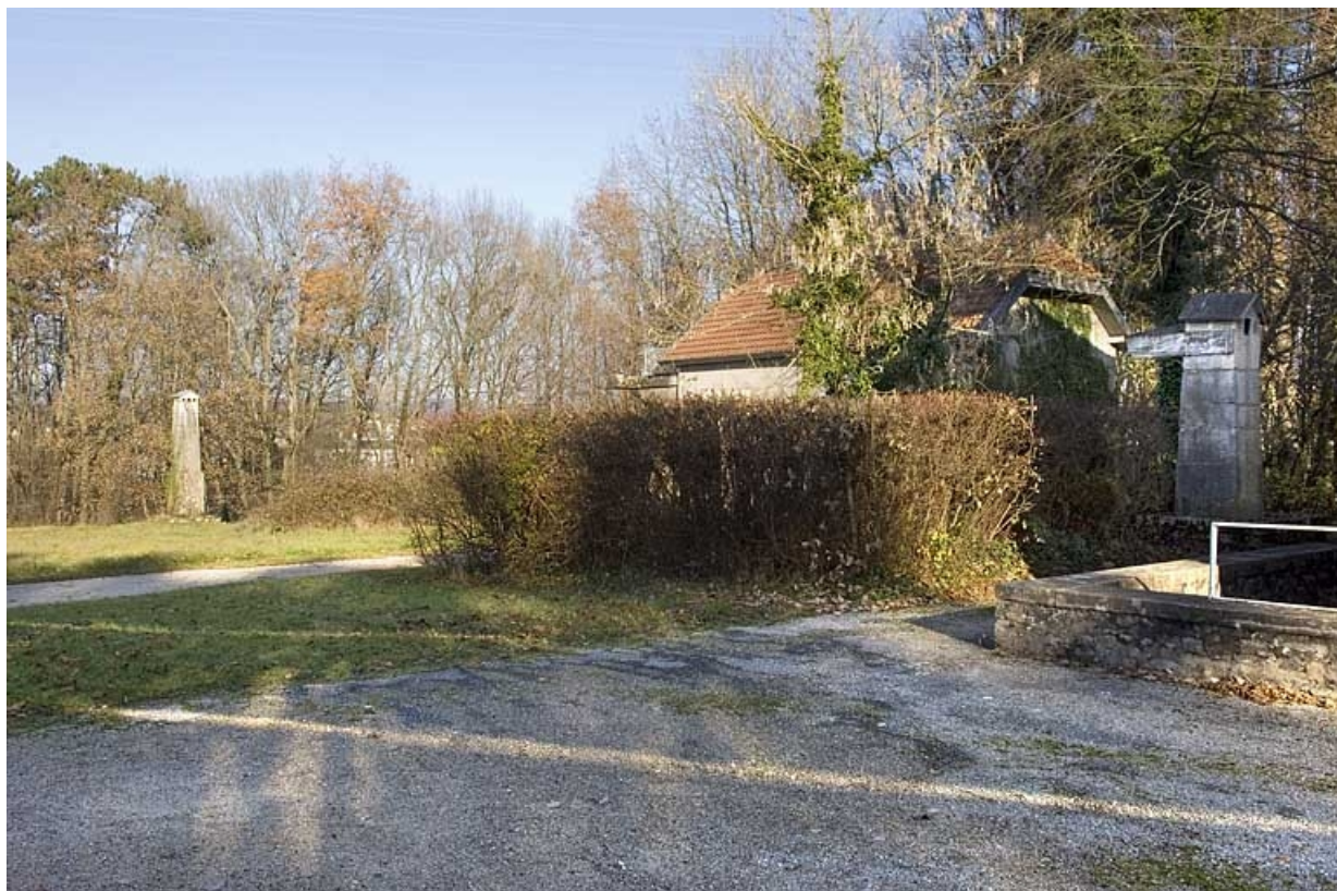
Mire nord de la lunette méridienne : pilier nord à gauche (mire) et pilier sud à droite (collimateur). 25, Besançon, 34 avenue de l' Observatoire, lieudit : la Bouloie