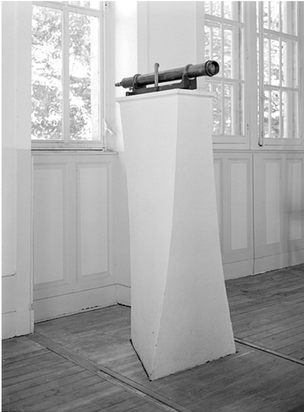
Mire nord de la lunette méridienne : pilier intérieur, avec son collimateur.

25, Besançon, 34 avenue de l' Observatoire, lieudit : la Bouloie