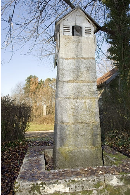
Mire nord de la lunette méridienne : pilier sud (collimateur).

25, Besançon, 34 avenue de l' Observatoire, lieudit : la Bouloie