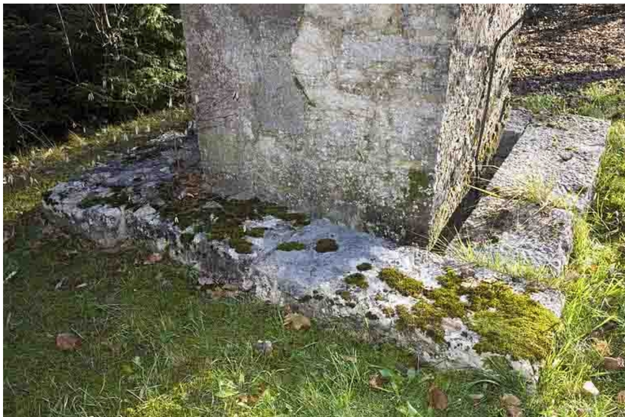
Mire sud de la lunette méridienne, pilier sud : fossé de stabilisation à la base du pilier. 25, Besançon, 34 avenue de l' Observatoire, lieudit : la Bouloie