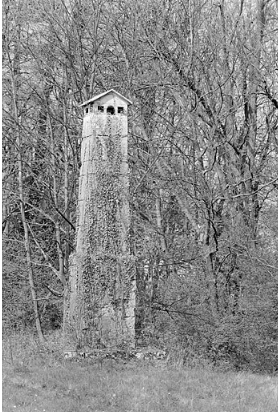
Mire nord de la lunette méridienne : pilier nord (mire).

25, Besançon, 34 avenue de l' Observatoire, lieudit : la Bouloie