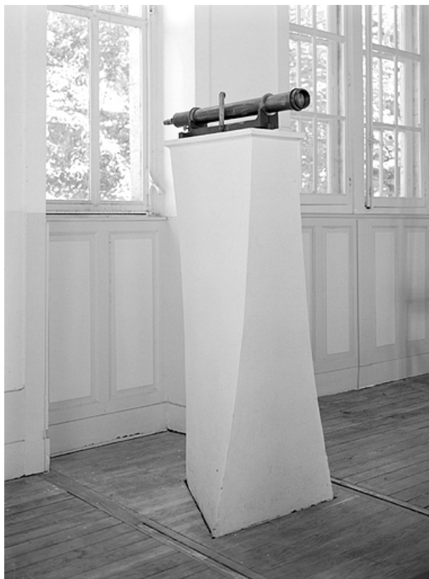
Mire nord de la lunette méridienne : pilier intérieur, avec son collimateur.

25, Besançon, 34 avenue de l' Observatoire, lieudit : la Bouloie