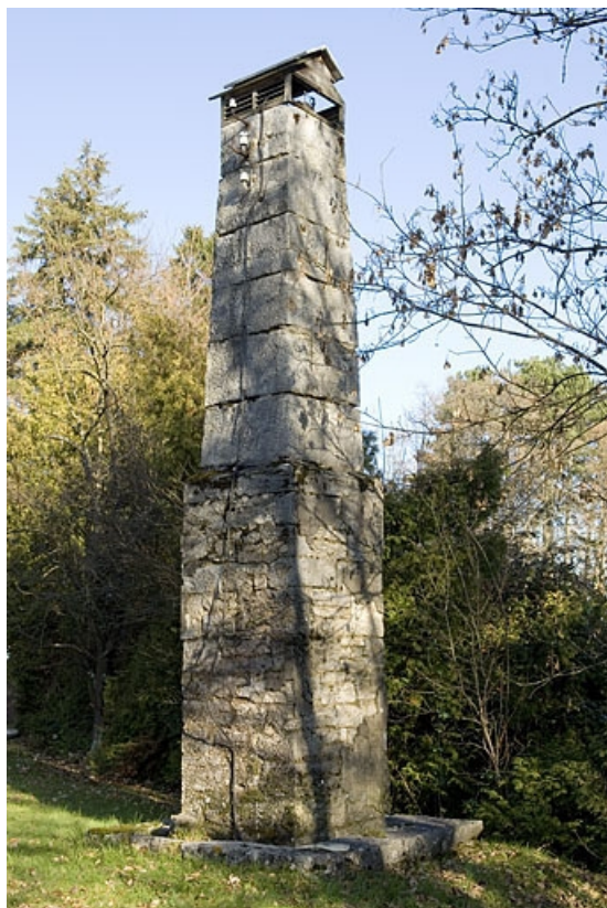
Mire sud de la lunette méridienne : pilier sud (mire).

25, Besançon, 34 avenue de l' Observatoire, lieudit : la Bouloie