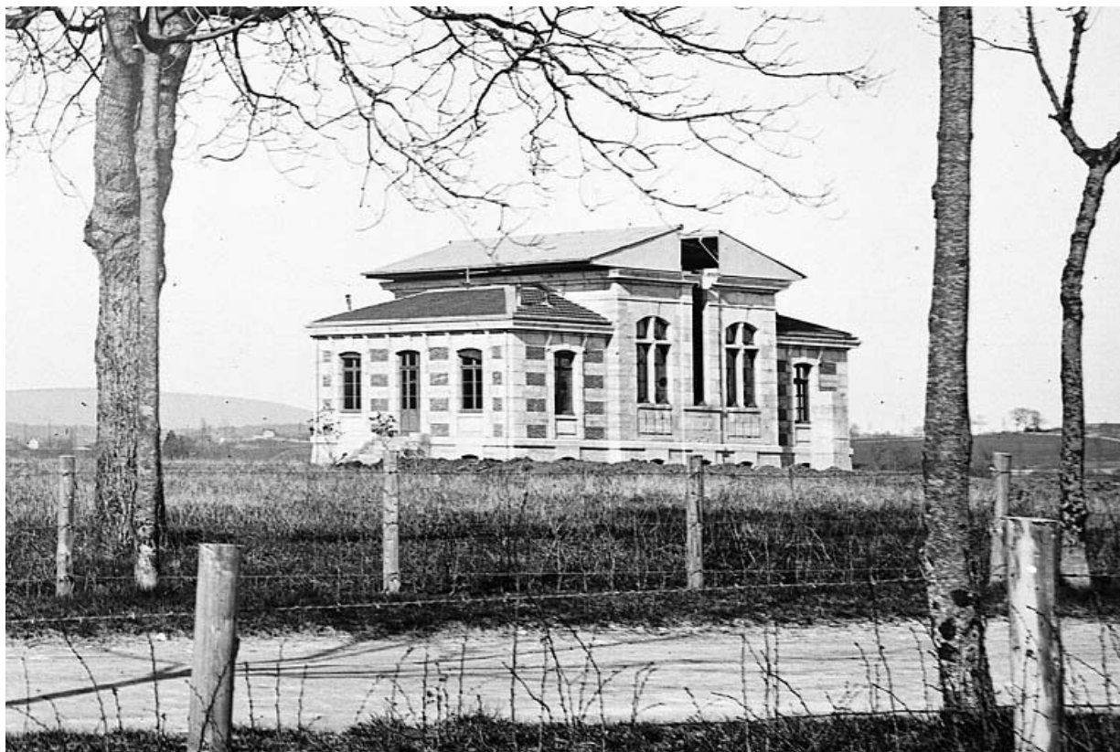
[Le pavillon de la lunette méridienne vu depuis le sud, sans mire proche ni collimateur sur le pilier], entre 1884 et 1888. 25, Besançon, 34 avenue de l' Observatoire, lieudit : la Bouloie