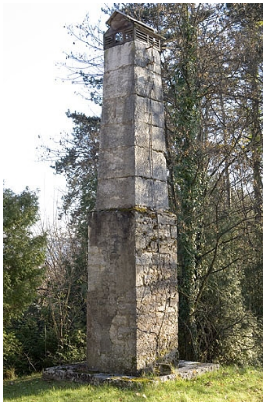
Mire sud de la lunette méridienne : pilier sud (mire).

25, Besançon, 34 avenue de l' Observatoire, lieudit : la Bouloie