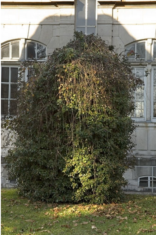
Mire sud de la lunette méridienne : pilier nord (collimateur).

25, Besançon, 34 avenue de l' Observatoire, lieudit : la Bouloie