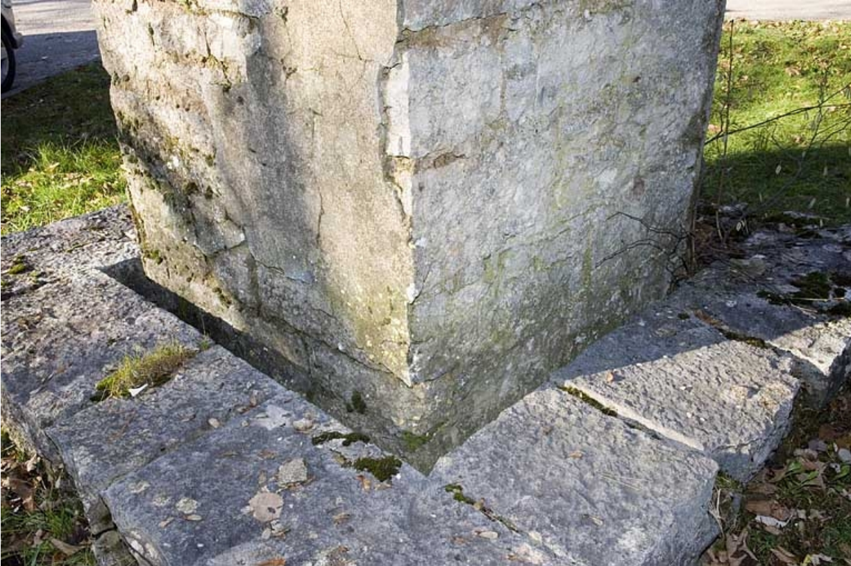
Mire sud de la lunette méridienne, pilier sud : fossé de stabilisation à la base du pilier. 25, Besançon, 34 avenue de l' Observatoire, lieudit : la Bouloie