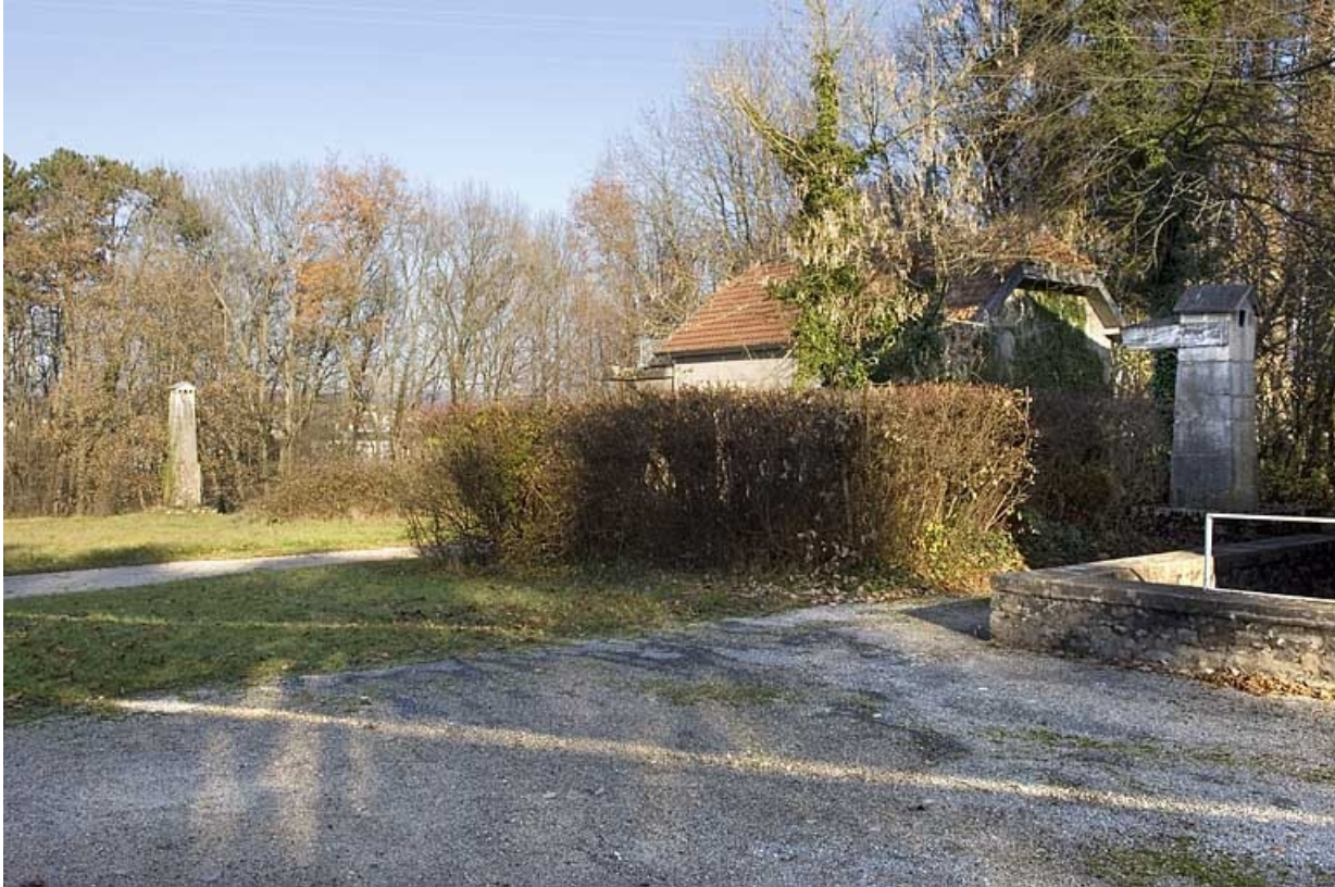
Mire nord de la lunette méridienne : pilier nord à gauche (mire) et pilier sud à droite (collimateur). 25, Besançon, 34 avenue de l' Observatoire, lieudit : la Bouloie