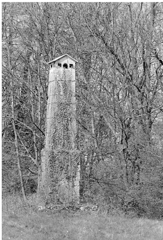
Mire nord de la lunette méridienne : pilier nord (mire).

25, Besançon, 34 avenue de l' Observatoire, lieudit : la Bouloie