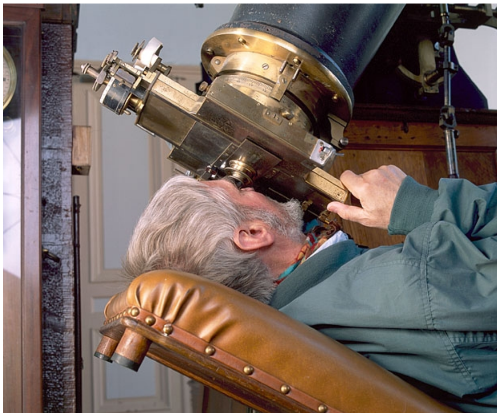
Observation avec le micromètre depuis le siège d'astronome : vue de détail.

25, Besançon, 34 avenue de l' Observatoire, lieudit : la Bouloie