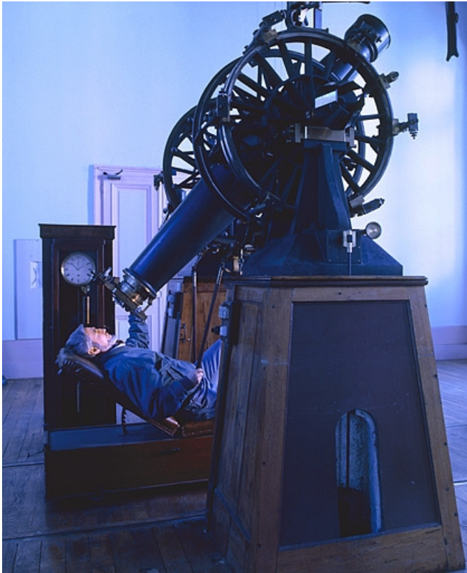
Observation avec le micromètre depuis le siège d'astronome.

25, Besançon, 34 avenue de l' Observatoire, lieudit : la Bouloie