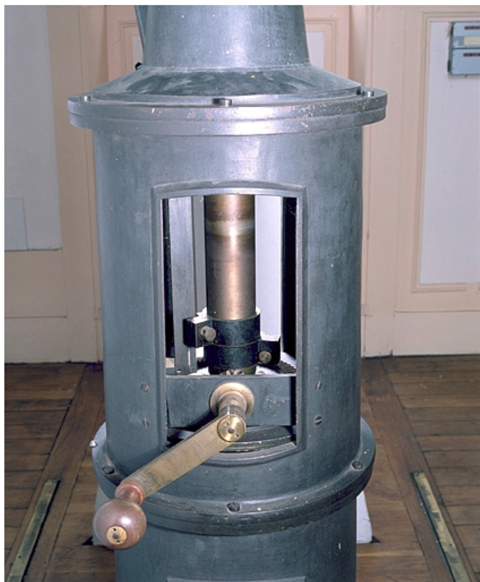
Détail de la colonne : manivelle permettant d'actionner le cric.

25, Besançon, 34 avenue de l' Observatoire, lieudit : la Bouloie