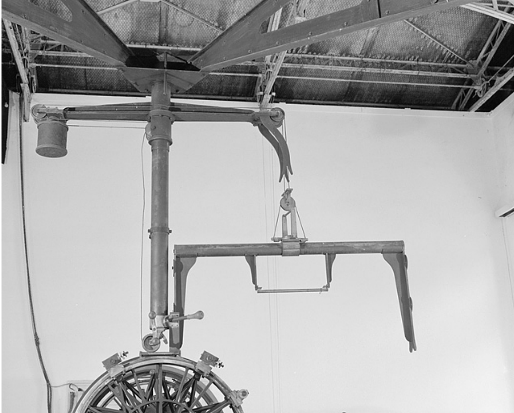
Vue latérale du support du niveau suspendu.

25, Besançon, 34 avenue de l' Observatoire, lieudit : la Bouloie