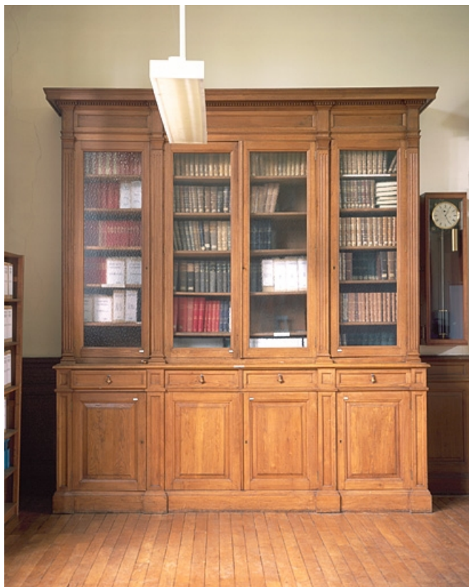
Vue d'ensemble d'une armoire-bibliothèque de la bibliothèque.

25, Besançon, 34, 36, 41 à 43 avenue de l' Observatoire, lieudit : la Bouloie