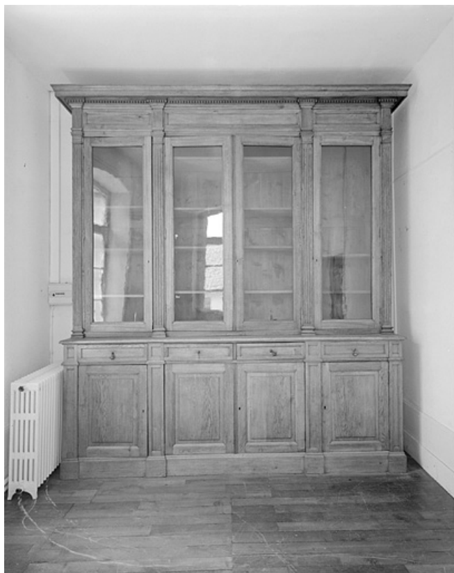
Vue d'ensemble d'une armoire-bibliothèque du pavillon de la méridienne.

25, Besançon, 34, 36, 41 à 43 avenue de l' Observatoire, lieudit : la Bouloie