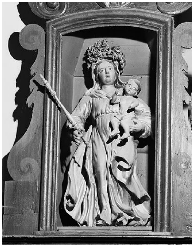
Vierge à l'Enfant.