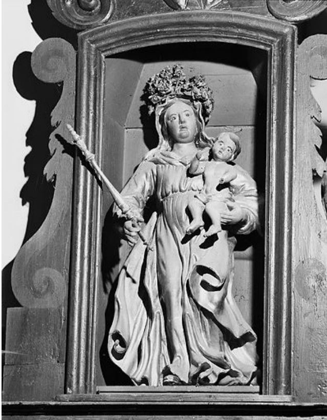
Vierge à l'Enfant.