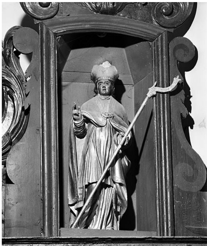
Saint Claude. 25, Vuillecin