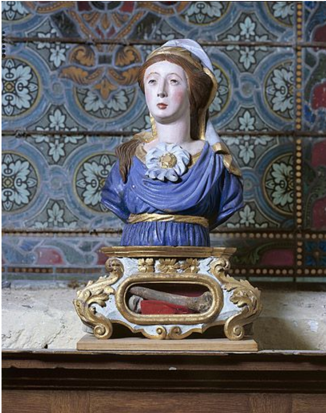
Buste de femme.