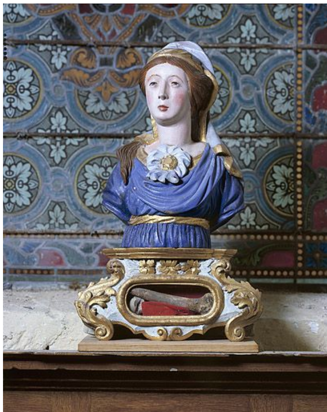
Buste de femme.