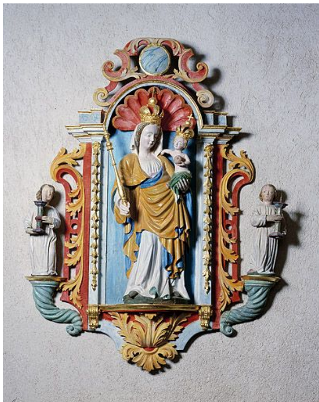
Vierge à l'Enfant.