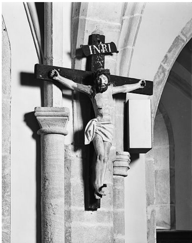
Vue d'ensemble. 25, La Planée