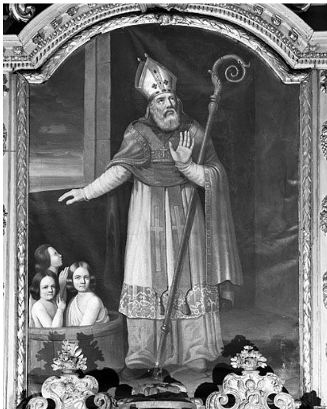
Tableau d'autel : saint Nicolas.