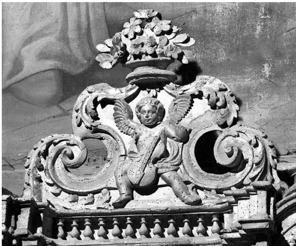
Ange musicien, aile droite du tabernacle. 25, Oye-et-Pallet