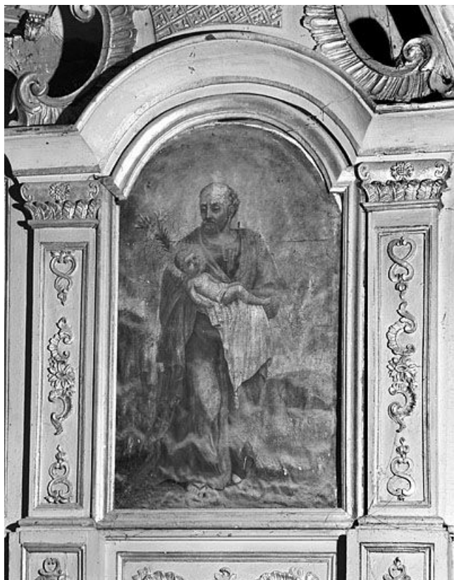
Tableau : saint Joseph. 25, Oye-et-Pallet