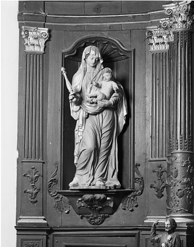
Vierge à l'Enfant. 25, Sainte-Colombe