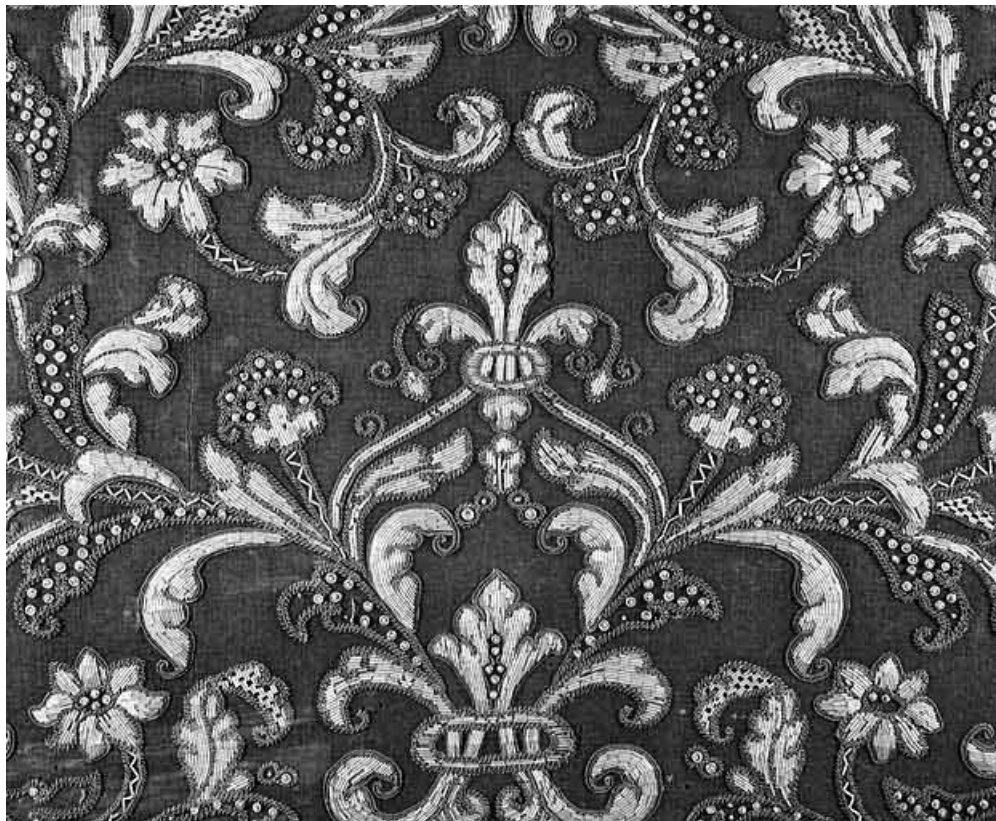
Détail du motif central.