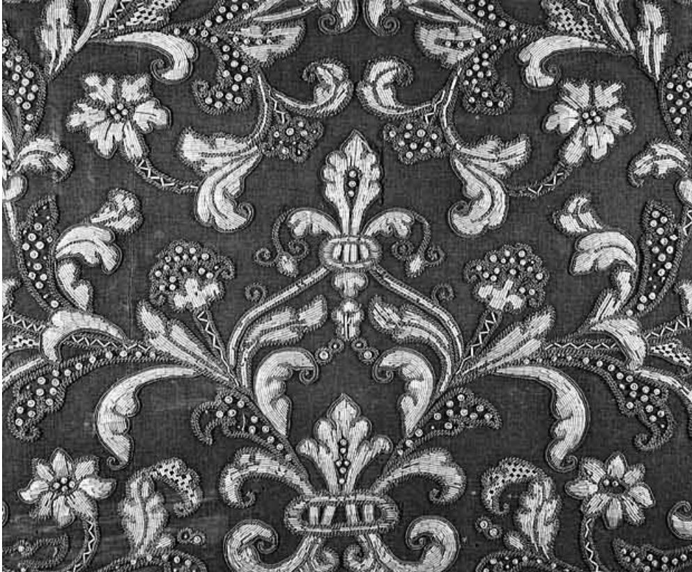
Détail du motif central.