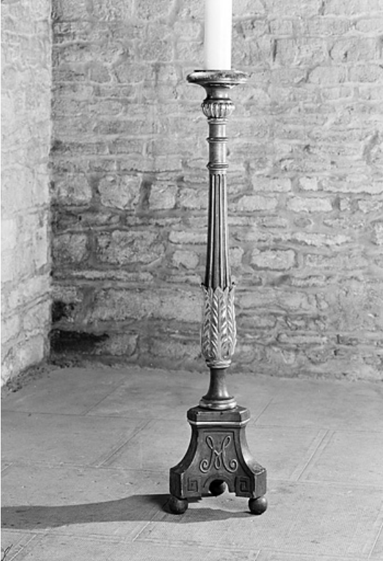
Vue générale d'un chandelier.