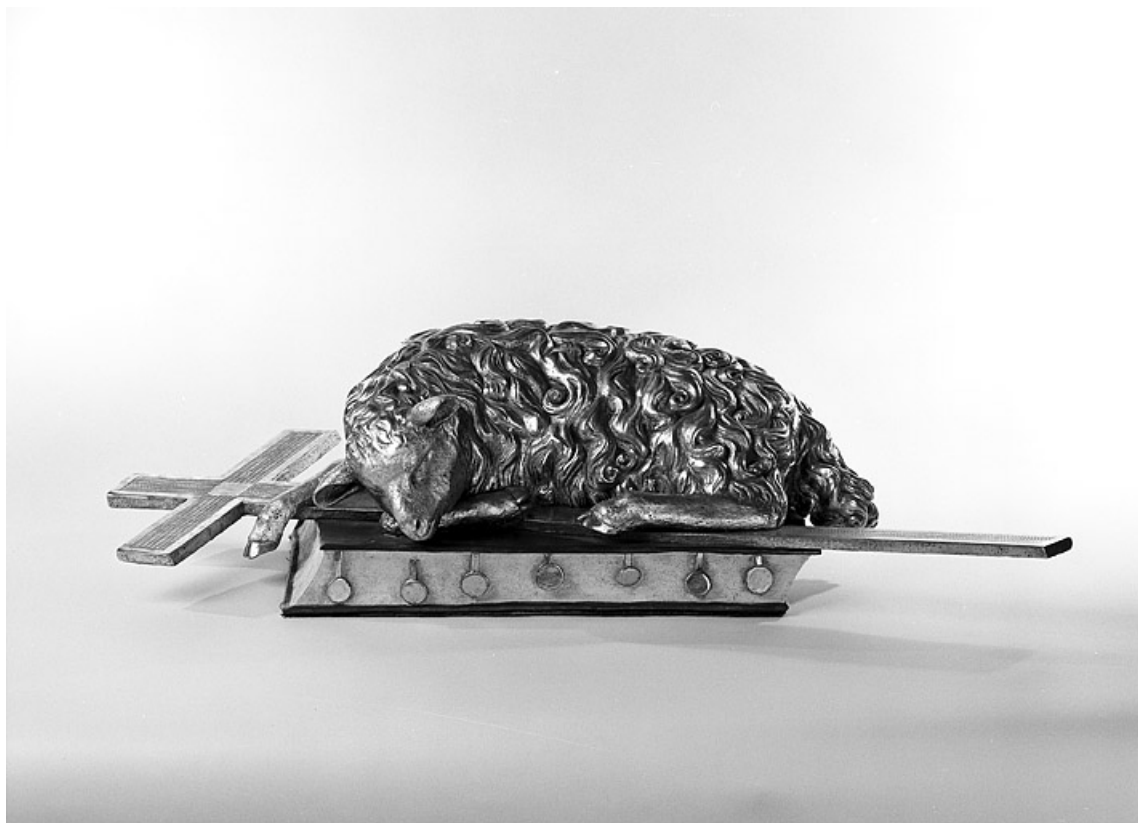
Relief : Agneau pascal.