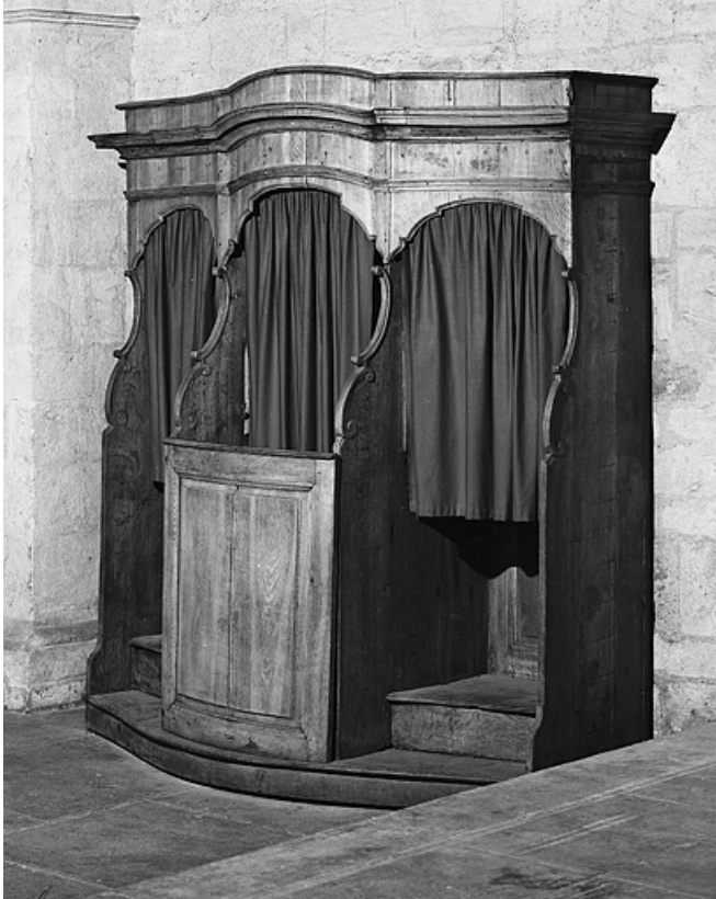
Vue d'un confessionnal.