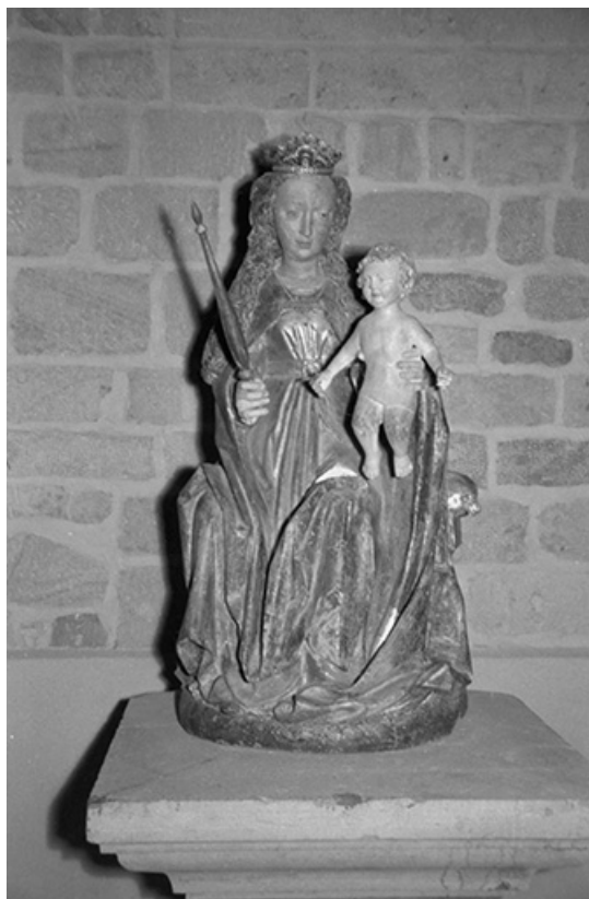
Vue de face en 1968.