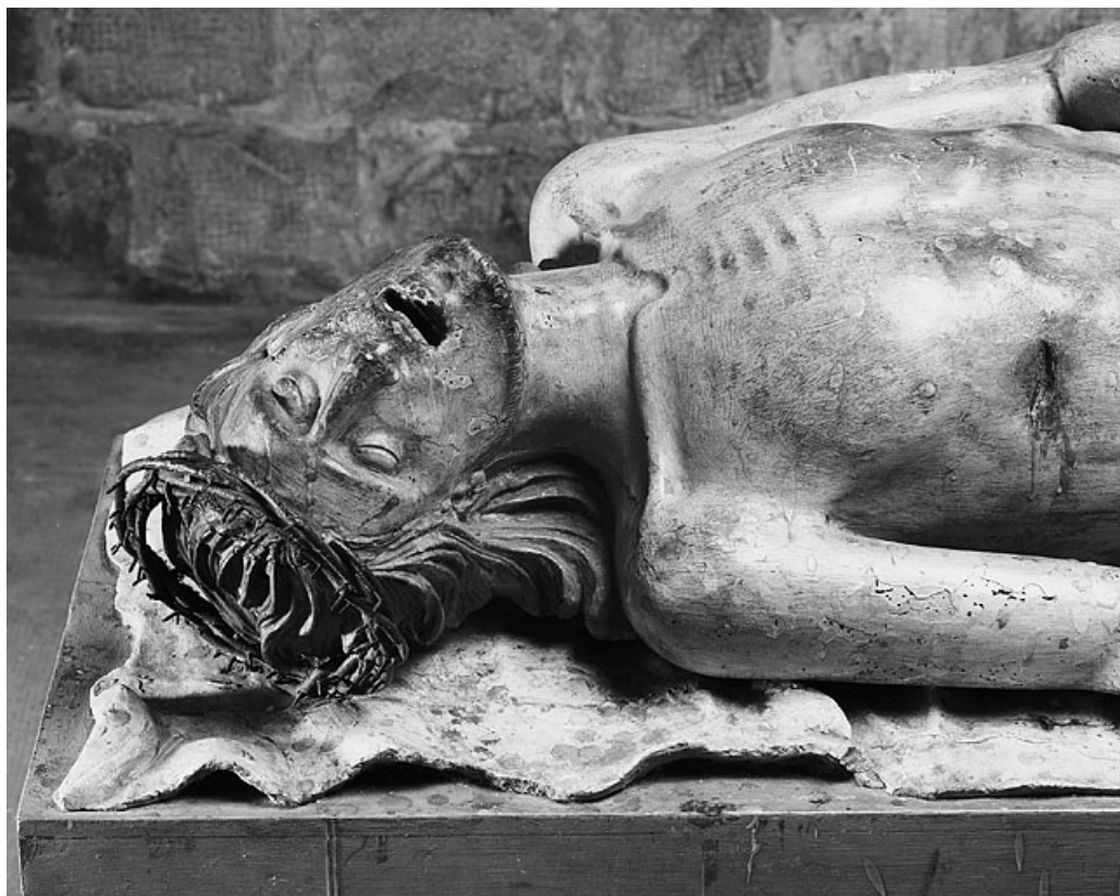
Détail : le visage.