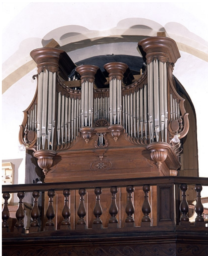
Vue générale de trois quarts droit.