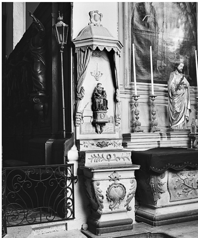
Vue d'ensemble de l'exposition situé à gauche de l'autel retable secondaire sud.