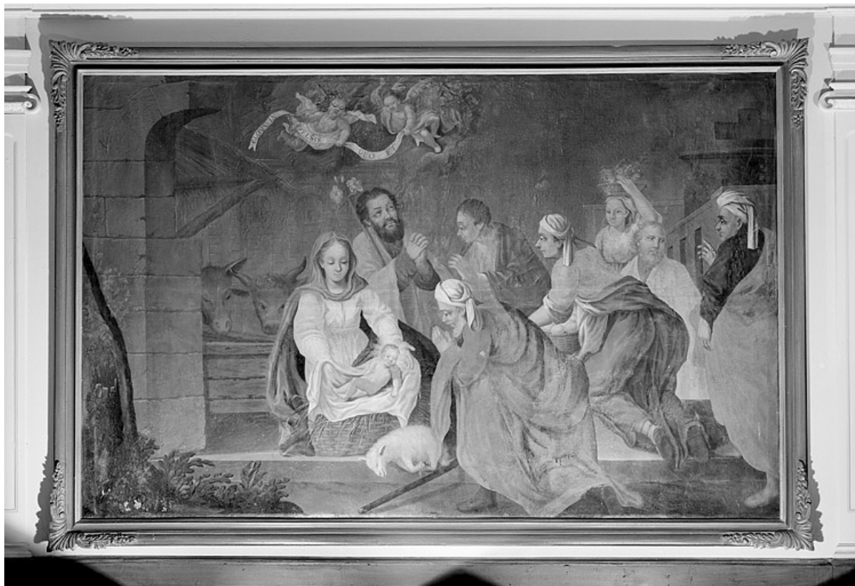
L'Adoration des Bergers.