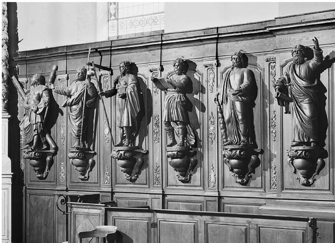
Vue d'ensemble du côté sud.