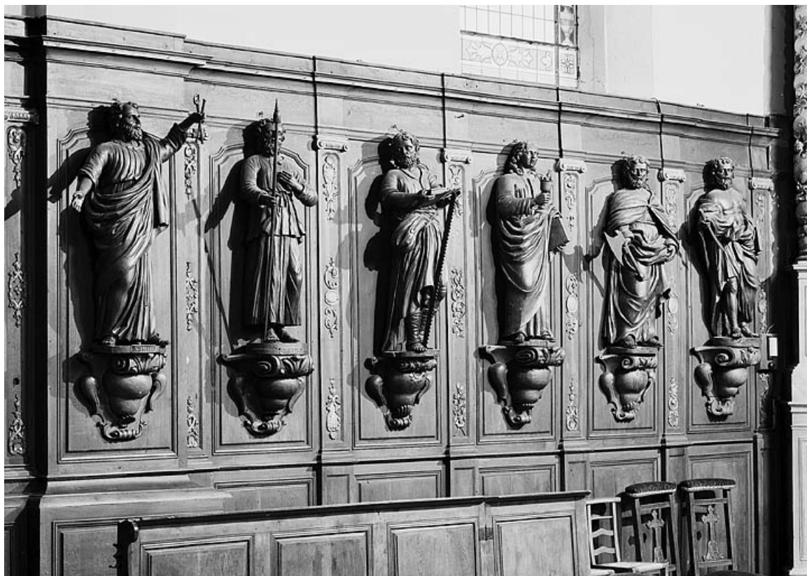
Vue d'ensemble du côté nord.