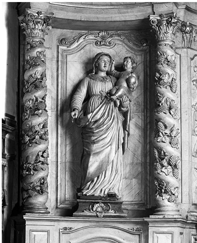
Vierge à l'Enfant.