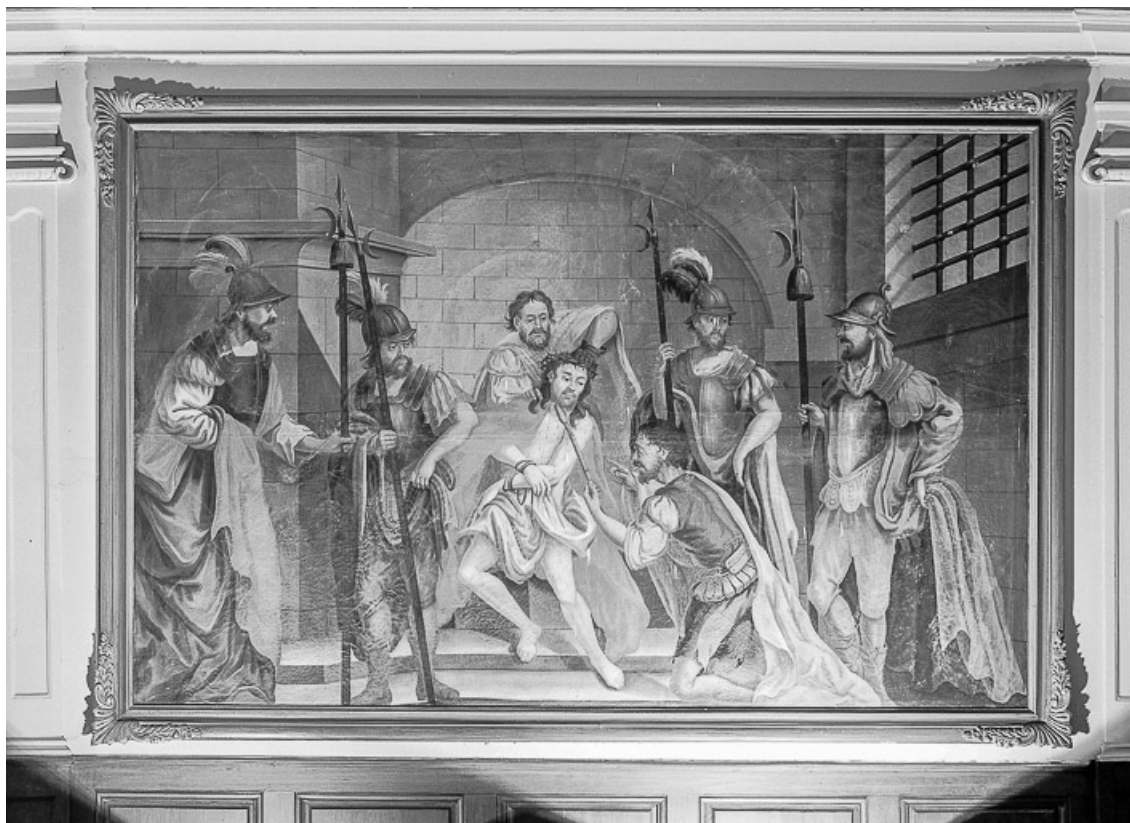
Le Christ aux outrages.