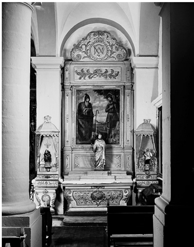
Vue d'ensemble de l'autel secondaire sud.