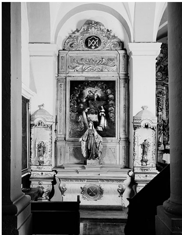
Vue d'ensemble de l'autel secondaire nord.