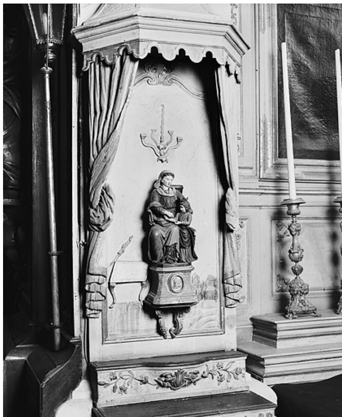
L'Education de la Vierge.