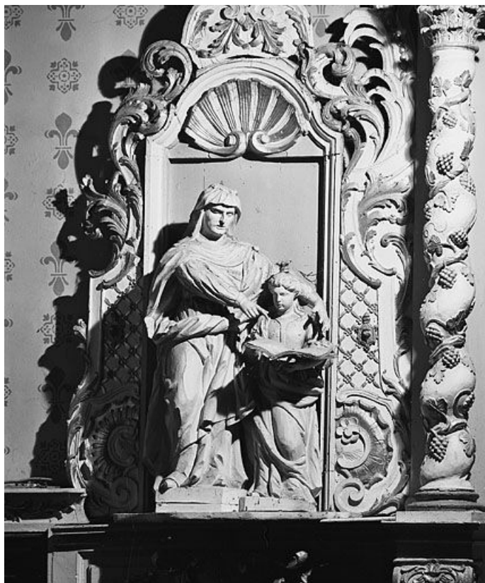
Education de la Vierge.