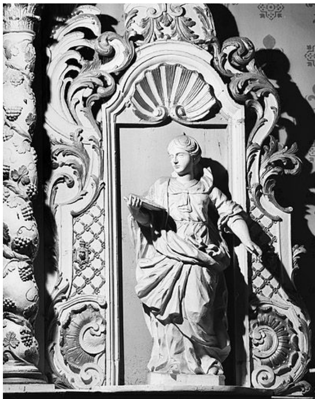
Sainte Agathe (?). 25, Montperreux