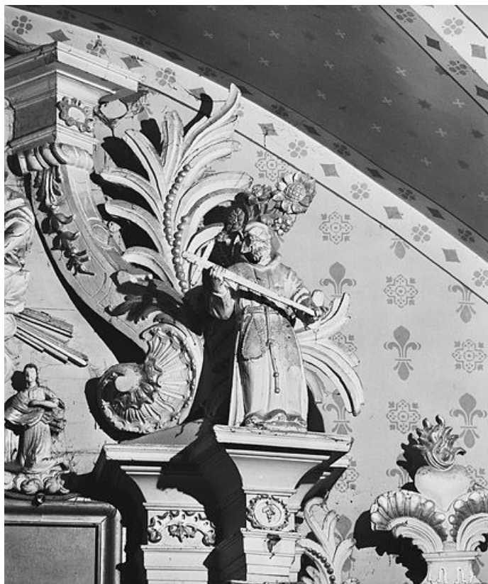
Statue : saint moine.