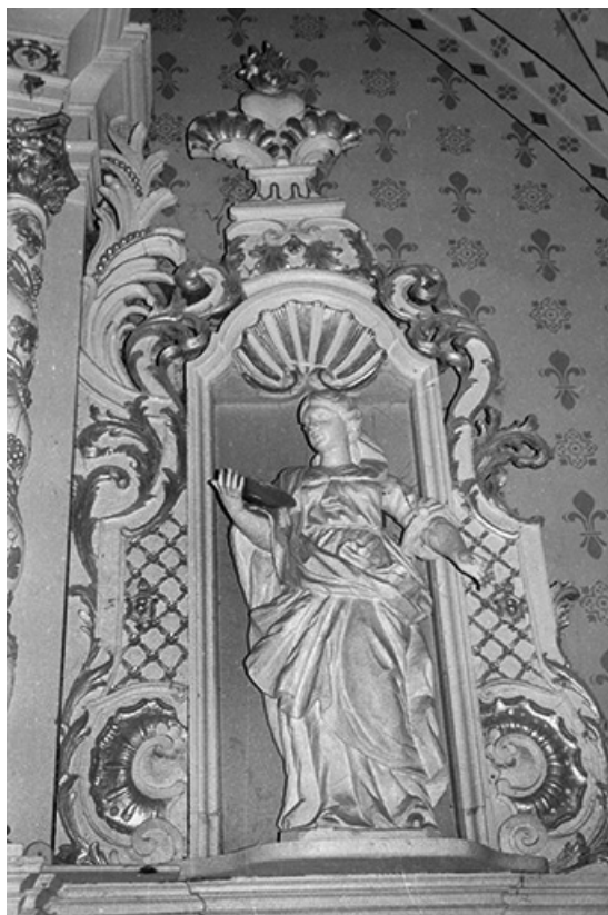
Statue à droite du retable.