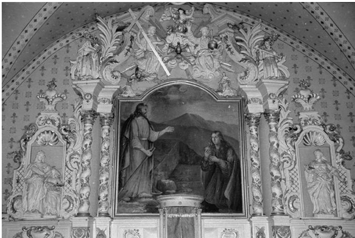
Retable avec le tableau de l'Apparition du Christ à Marie-Madeleine. 25, Montperreux