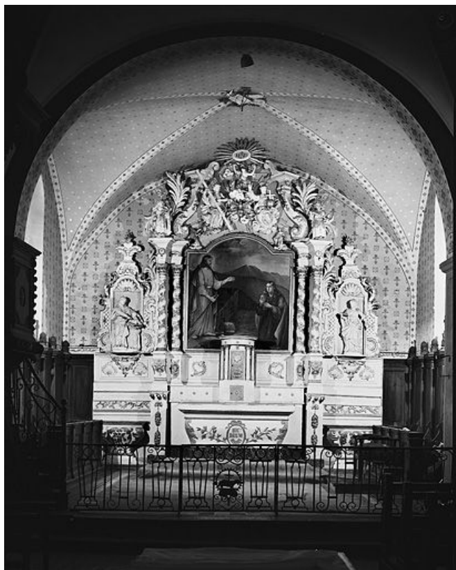
Vue d'ensemble. 25, Montperreux