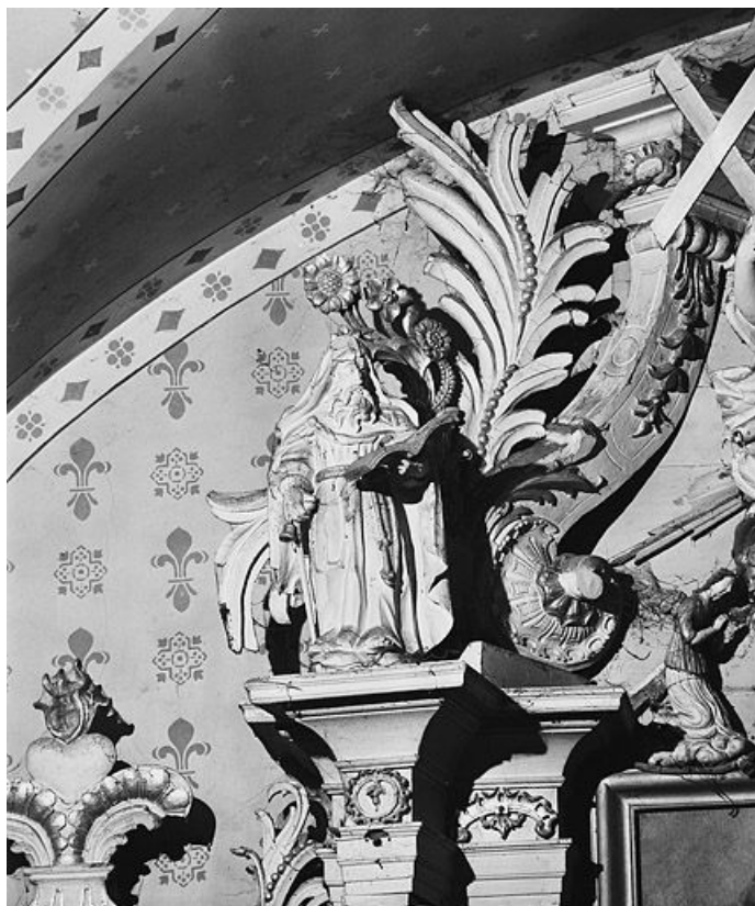
Statue : saint Antoine. 25, Montperreux