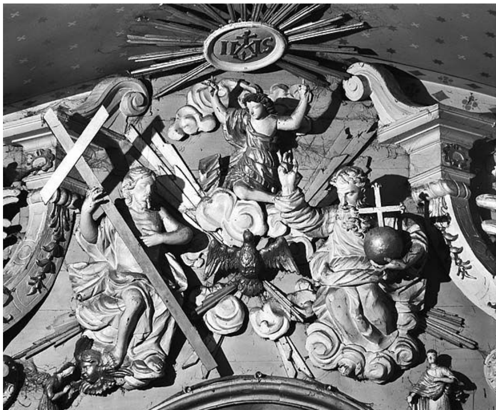
Détail : la gloire. 25, Montperreux