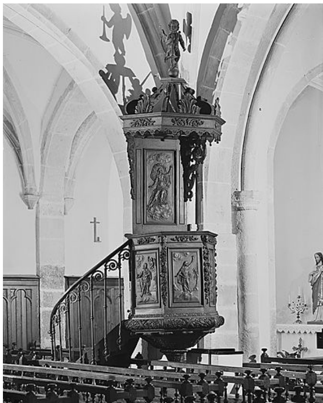
Vue d'ensemble. 25, Bouverans