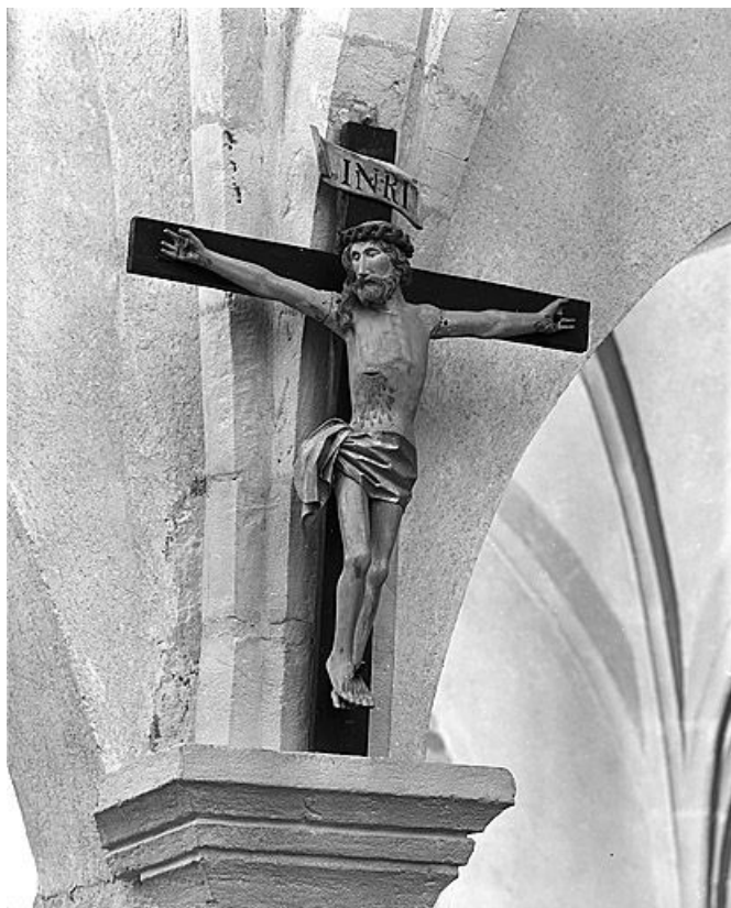
Vue de trois quarts gauche.