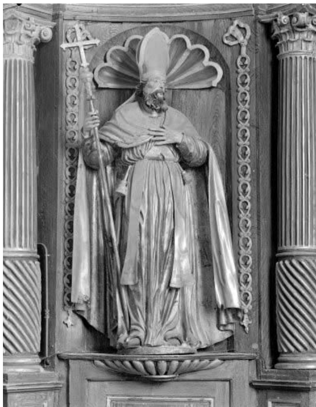
Saint Ambroise (?) . 25, Malpas