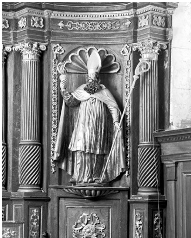
Saint Augustin 25, Malpas