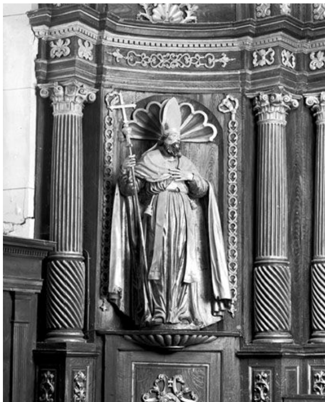
Saint Ambroise (?) . 25, Malpas