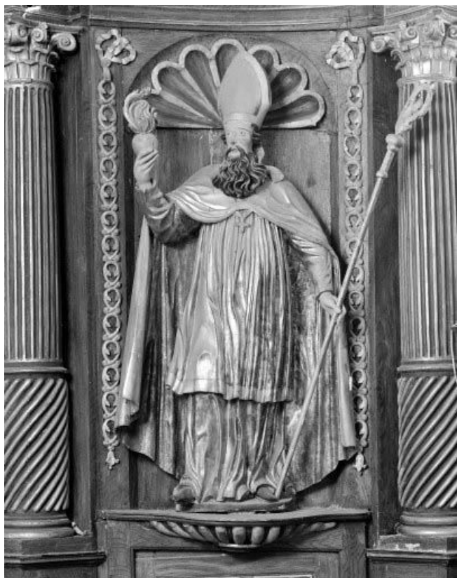
Saint Augustin 25, Malpas