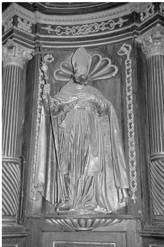
Statue d'évêque à gauche du retable. 25, Malpas