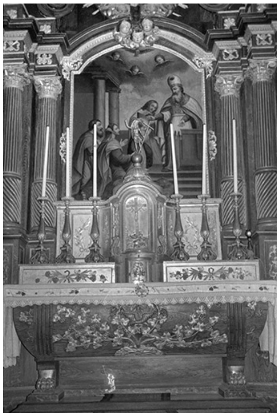
Autel et tableau du retable.