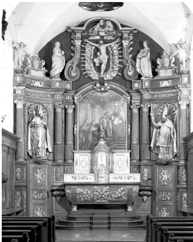
Vue d'ensemble. 25, Malpas