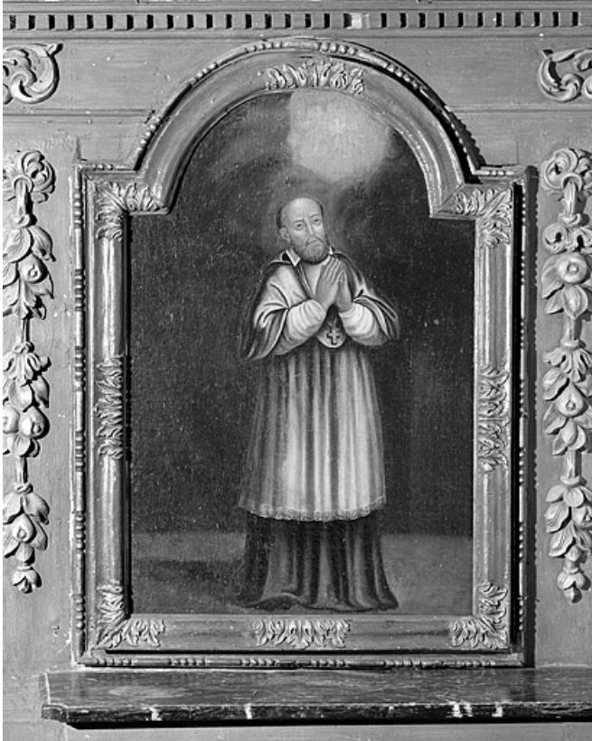
Saint François-Xavier. 25, Les Hôpitaux-Neufs